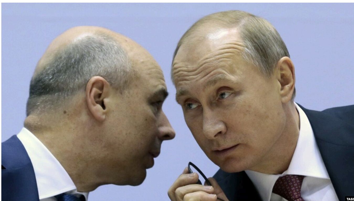
Антон Силуанов и Владимир Путин

Государственная Дума в пожарном порядке сразу в трех чтениях приняла внесенные правительством поправки к Бюджетному кодексу. Они дают министерству финансов право без всякого согласования наращивать расходы федерального бюджета и занимать для этого на внутреннем рынке любые суммы, без оглядки на заложенный в бюджете лимит госдолга. Помимо прочего, это может означать смену неформального лидера финансово-экономического блока, которому Путин доверяет определять экономический курс.