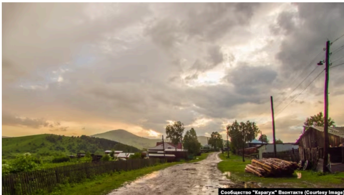
Деревня Карагуж - типичный сельский пейзаж

Долина Свободы появилась в 20-е годы как сельхозкоммуна. Однако в 1925 году половодье уничтожило посевы, и коммуны пришлось распустить. В соседней Усть-Ише в это время бушевала эпидемия сифилиса. Во время коллективизации в этих местах случались выступления против советской власти: в 1930 году крестьяне собрались в поселке Пролетарский, чтобы потребовать роспуска сельскохозяйственной артели. Одного из участников акции разбил приступ эпилепсии. Товарищи подумали, что его убили, после чего начались беспорядки. Руководству артели пришлось бежать в Усть-Ишу, пока восставших не разогнала армия.