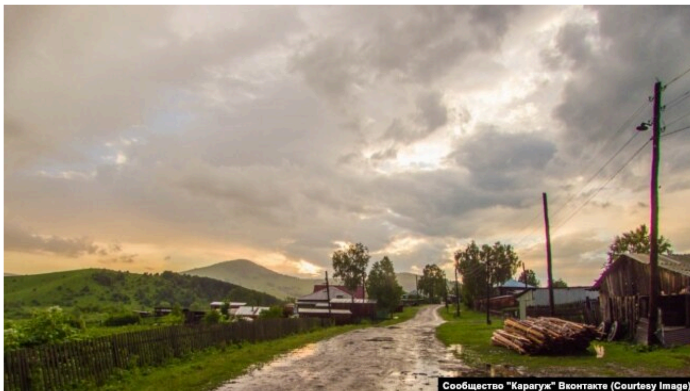
Деревня Карагуж - типичный сельский пейзаж

Долина Свободы появилась в 20-е годы как сельхозкоммуна. Однако в 1925 году половодье уничтожило посевы, и коммуны пришлось распустить. В соседней Усть-Ише в это время бушевала эпидемия сифилиса. Во время коллективизации в этих местах случались выступления против советской власти: в 1930 году крестьяне собрались в поселке Пролетарский, чтобы потребовать роспуска сельскохозяйственной артели. Одного из участников акции разбил приступ эпилепсии. Товарищи подумали, что его убили, после чего начались беспорядки. Руководству артели пришлось бежать в Усть-Ишу, пока восставших не разогнала армия.