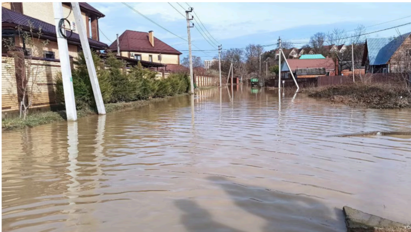
Наводнение в Краснодарском крае, 2023 год

Власти Крымского района Краснодарского края ввели режим чрезвычайной ситуации в четырех сельских поселениях из-за прорыва дамбы на реке Кубань в районе хутора Западного.