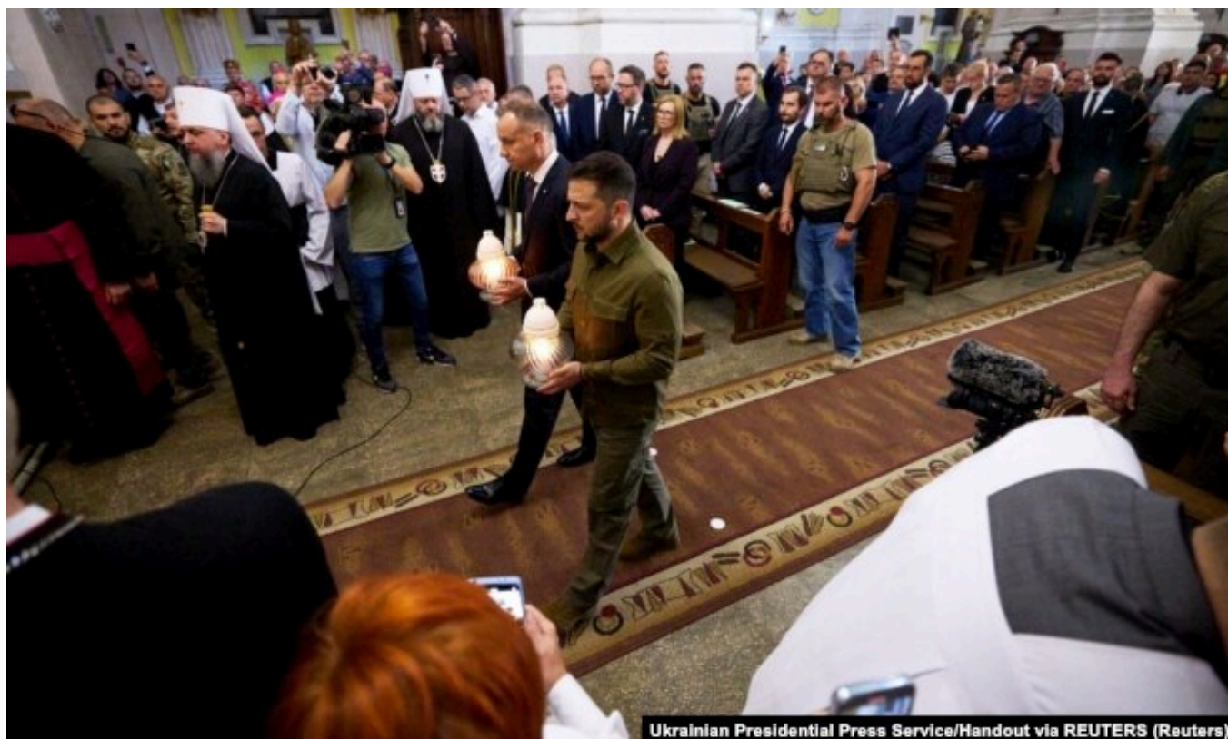
Президенты Польши и Украины Анджей Дуда и Владимир Зеленский на церемонии памяти жертв Волынской трагедии. Луцк, 9 июля 2023 года

В апреле 2023 года тогдашний президент Польши Анджей Дуда наградил этим высоким орденом своего украинского коллегу "за выдающиеся заслуги в углублении всесторонних дружественных отношений между Польшей и Украиной, за развитие сотрудничества на благо демократии, мира и безопасности в Европе, а также за непоколебимость в защите неотъемлемых прав человека" . Тогда же Зеленский заявил, что это награда для всего украинского народа.