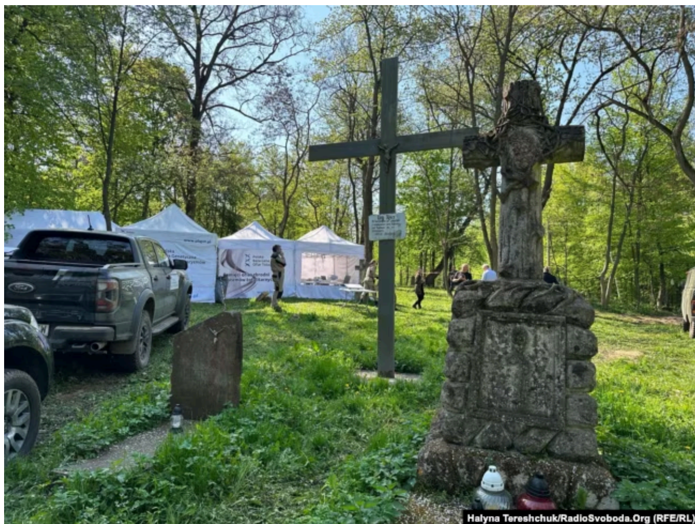
Работы по эксгумации жертв Волынской трагедии, апрель 2025 года