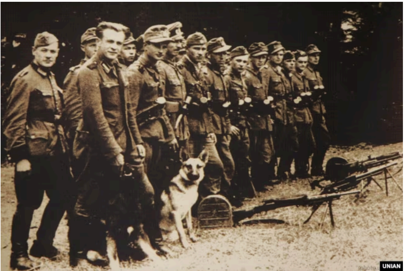
Бойцы УПА, Львовская область, июль 1944 года

С мая по ноябрь 1943 года главным командиром УПА был Дмитро Клячкивский , с 1944 по 1950 год – Роман Шухевич , с 1950 по 1954 год – Василь Кук .