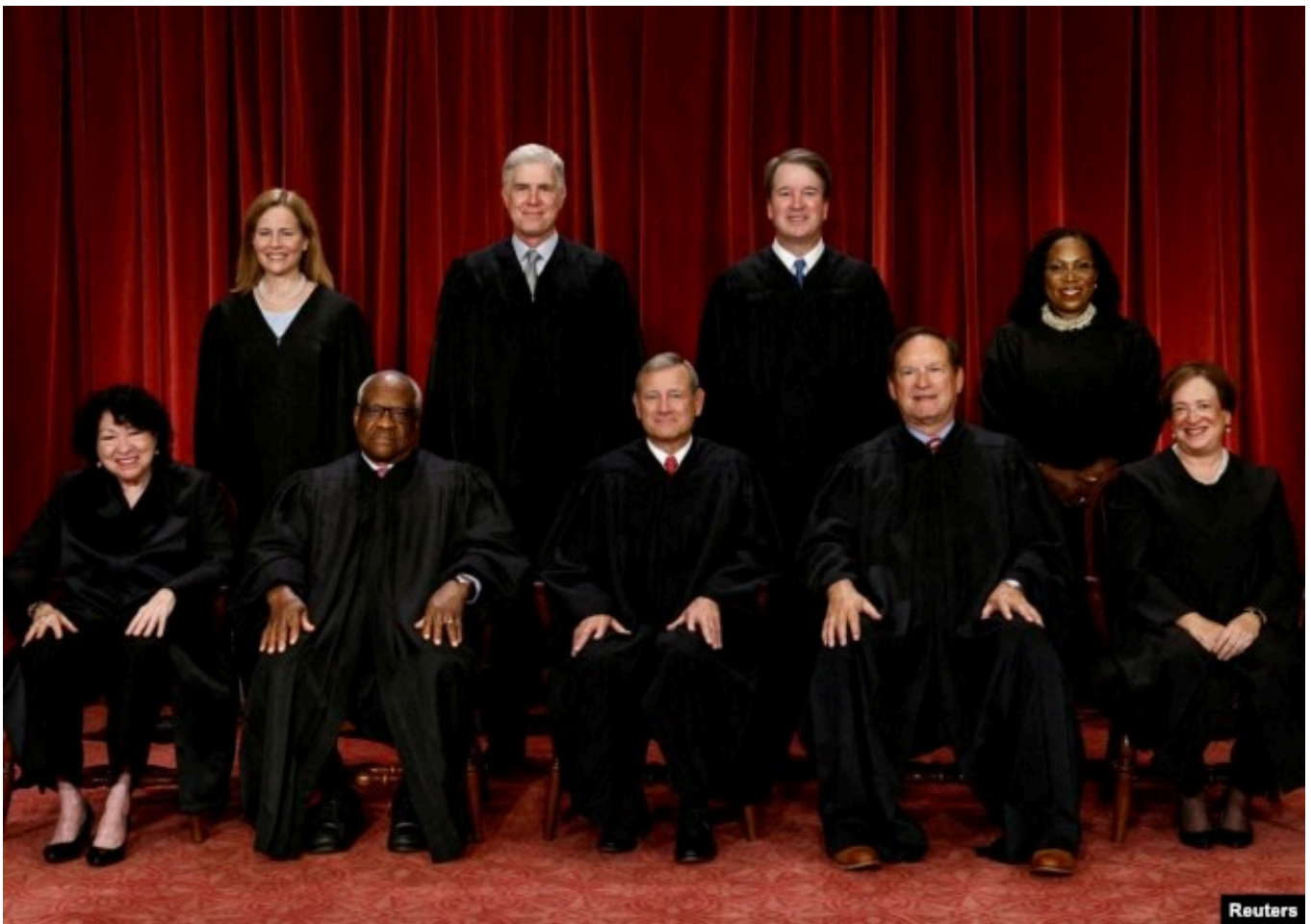
Судьи Верховного суда США, 2022 год

– Еще одно дело, касающееся порядка проведения выборов, находится на рассмотрении в Верховном суде, решения ожидают в ближайшее время, "Уотсон против Национального комитета Республиканской партии". Во многих штатах местные законы позволяют подсчитывать присланные по почте бюллетени уже после дня выборов – если были посланы до официального дня выборов, и есть подтверждающий это почтовый штамп. Особенно это получило распространение во время пандемии ковида, когда многие голосовали по почте – и это было в особенности популярно среди сторонников демократов. И вот в Миссисипи закон, дающий пять рабочих дней на подсчет бюллетеней, поступивших после дня выборов, был опротестован республиканцами, которые говорят, что федеральные законы устанавливают единый день выборов, а значит бюллетени должны быть поданы и получены до этого дня, чтобы выборы считались завершенными. При этом в самом законе не говорится напрямую о подсчете голосов: "Выборы проводятся во вторник, следующий за первым понедельником ноября", и все.