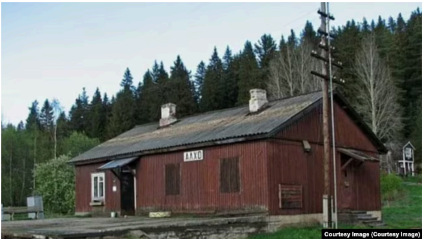
Алхо, ж-д станция

Сосед, если не пьет, иногда за деньги возит ее в магазин на своей машине в соседний город. А если пьет – спасает только огород.