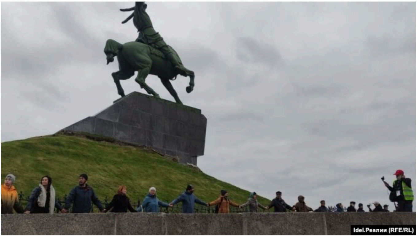
Акция у памятника Салавату Юлаеву. 11 октября 2021 года

Издание также писало, что памятник "накренился в сторону реки Белой на 11 мм", а его фундамент "осел на 70 мм".