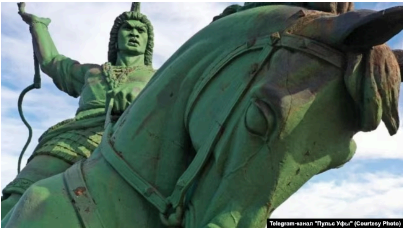
Памятник Салавату Юлаеву в Уфе. Архивное фото