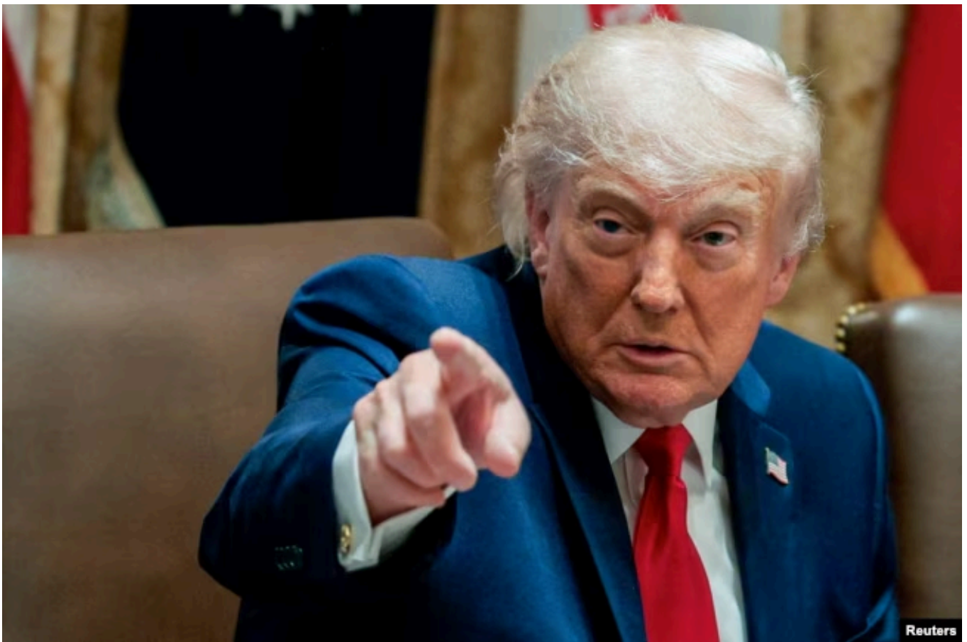
Дональд Трамп во время совещания в Белом доме. Вашингтон, 27 мая 2026 года

Сам Дональд Трамп описывает участие США во всех новых военных конфликтах как острую необходимость, продиктованную жестким отстаиванием национальных интересов Соединенных Штатов и реализацией принципа "мир через силу". При этом американский президент утверждает, что само существование у США мощнейших вооруженных сил на планете дает ему право их использовать, и что военная мощь – ключевой инструмент обеспечения безопасности страны.