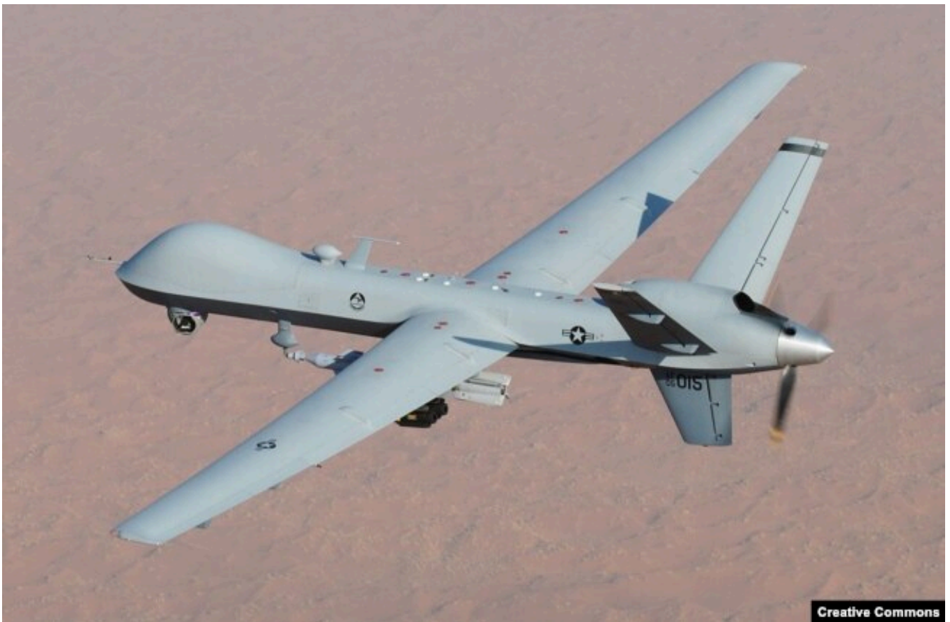
Тяжелый ударный БПЛА MQ-9 Reaper ВВС США