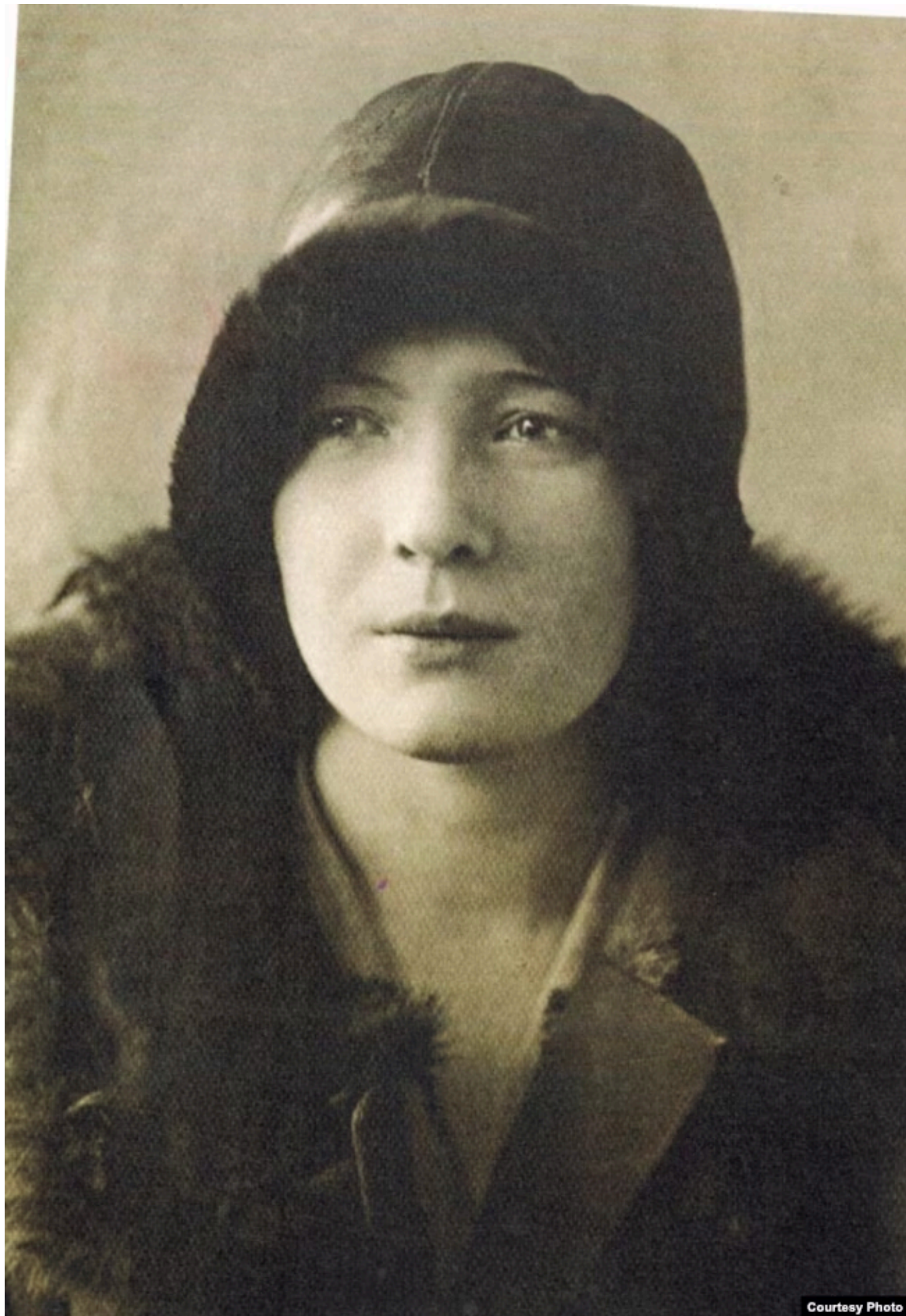
Ольга Берггольц, середина 1920-х.