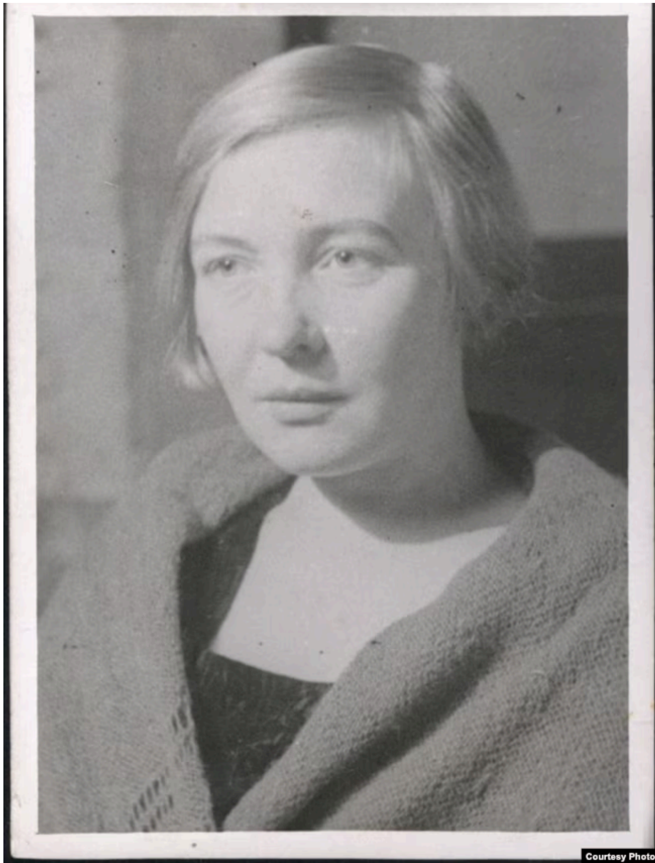
Ольга Берггольц, середина 1930-х.

В 1937 году ее выгоняют со всех работ, и она становится вообще на какое-то время учительницей в школе. И вот тут-то в “Кировской правде” описывается, что состоялось собрание писателей и журналистов города Кирова, доклад о борьбе с троцкистами. Ну, понятно, надо же каждому бежать впереди паровоза. И именно