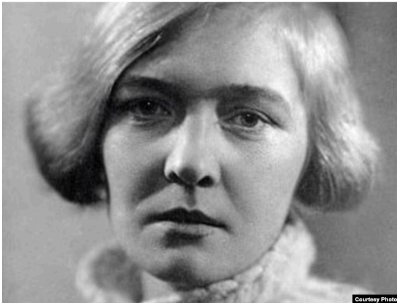
Ольга Берггольц, 1930-е.

руководителей ВКП(б). Исключена из Союза писателей. И среди прочего, что было, кстати, очень важно потом, у нее изъяли дневники. Вообще-то это очень по-своему любопытная история, потому что эти дневники - предмет отдельного авантюрно-приключенческого рассказа, потому что они сами потом уже прятались после ее смерти, к ним нельзя было иметь никакого доступа. Сергей Михалков написал резолюцию, что эти дневники порочат имя советского поэта. Это отдельная история.