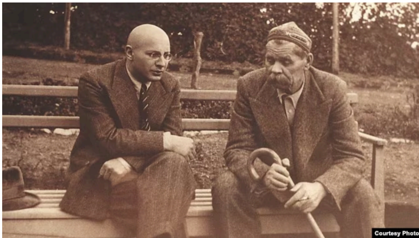
Леопольд Авербах и Максим Горький.