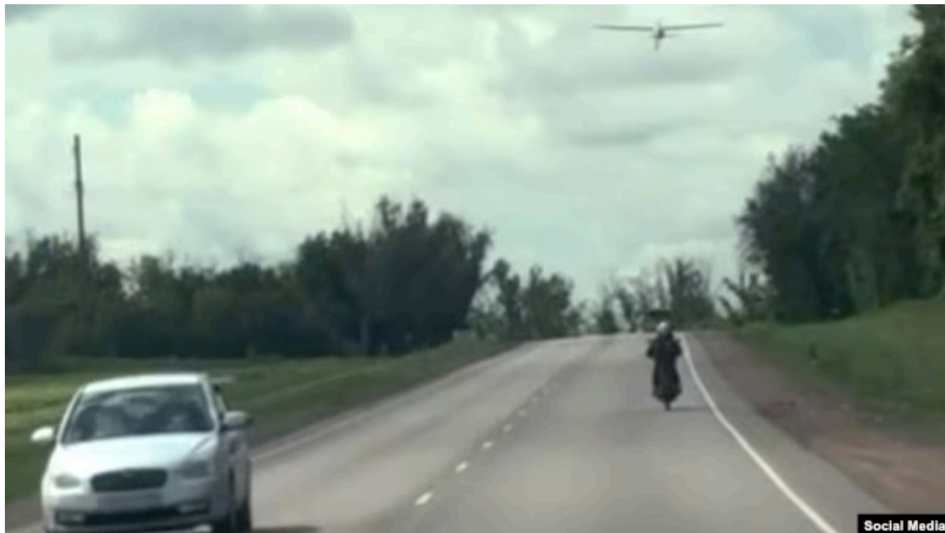
Дрон Hornet над дорогой в Крыму

"В результате БПЛА способен автономно выполнять полет по заданному маршруту, сводя к минимуму необходимость постоянного канала связи с оператором и значительно снижая эффективность типичных средств радиоэлектронной борьбы и детекторов дронов. После распознавания объектов оператор получает на экране подсказки о типе обнаруженных целей и самостоятельно принимает решение о выборе цели для поражения", – объясняют эксперты.