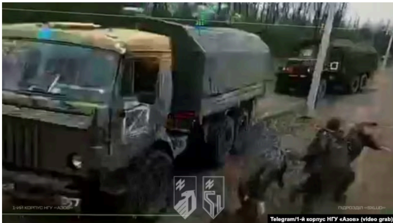
Удар по российской технике недалеко от Донецка

Якуб Яновский отмечает , что к 2025 году у украинских компаний уже был большой опыт и широкие возможности в вопросе производства дронов, и существующие платформы требовали лишь небольших изменений для развития новой ударной кампании – на этот раз средней дальности. В течение прошлого года украинский ВПК сталкивался с нехваткой ресурсов для подобного перепрофилирования, но после решения этих проблем украинские дроны средней дальности "начали сеять хаос в российской логистике".