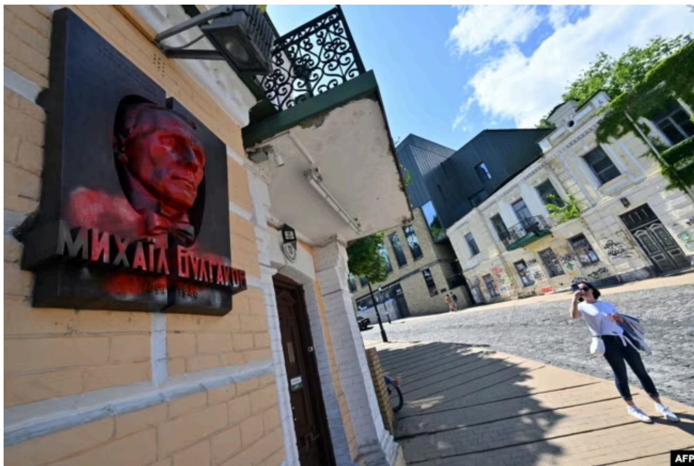
Облитая краской памятная доска на стене музея Булгакова в Киеве, 31 мая 2023 года

Ну о том, что не тебе, Сережа, про*бавшем собственную страну, в принципе судить о внутренней политике соседней, промолчу. Кажется, это очевидно.