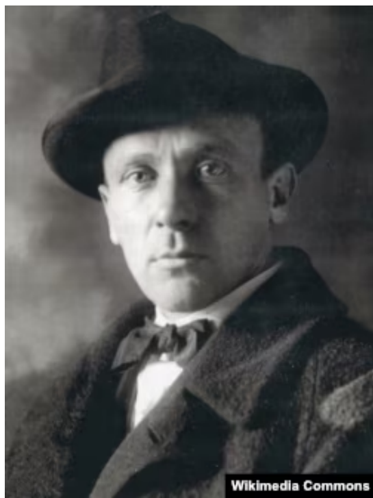
Михаил Булгаков, 1928 год

Выбором, впрочем, не нейтральным, а экзистенциальным, когда грохочут взрывы и на твой дом летят ракеты и дроны все той же империи.