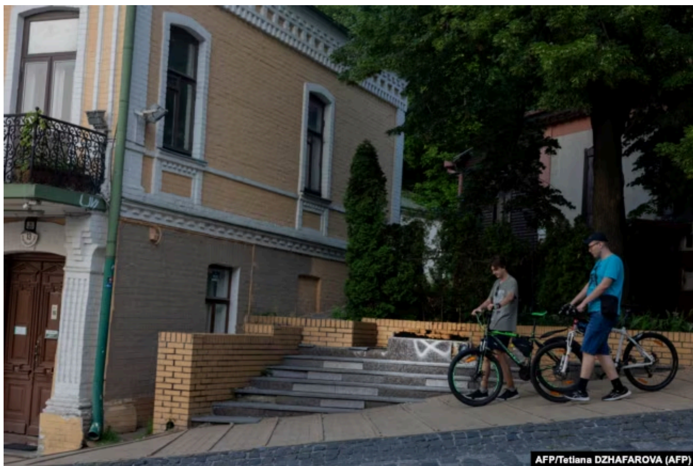
Постамент, оставшийся от памятника Булгакову в Киеве, 4 июня 2026 года

Давненько я не видела, чтобы хорошие русские выразили боль относительно баллистики на Киев и Харьков. Хотя бы сожаление, не говоря, про жгучую вину. Но памятник Булгакову всех порвал. Вам не приходит в голову, что это просто не ваше дело? Да, так бывает. Какие статуэтки стоят у меня дома и какие картинки висят на стенах – не ваше дело.