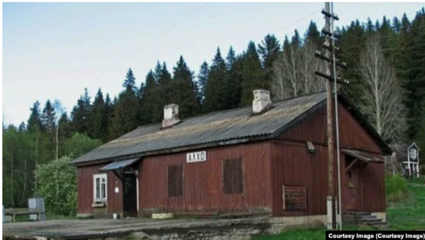
Алхо, ж-д станция

Сосед, если не пьет, иногда за деньги возит ее в магазин на своей машине в соседний город. А если пьет – спасает только огород.