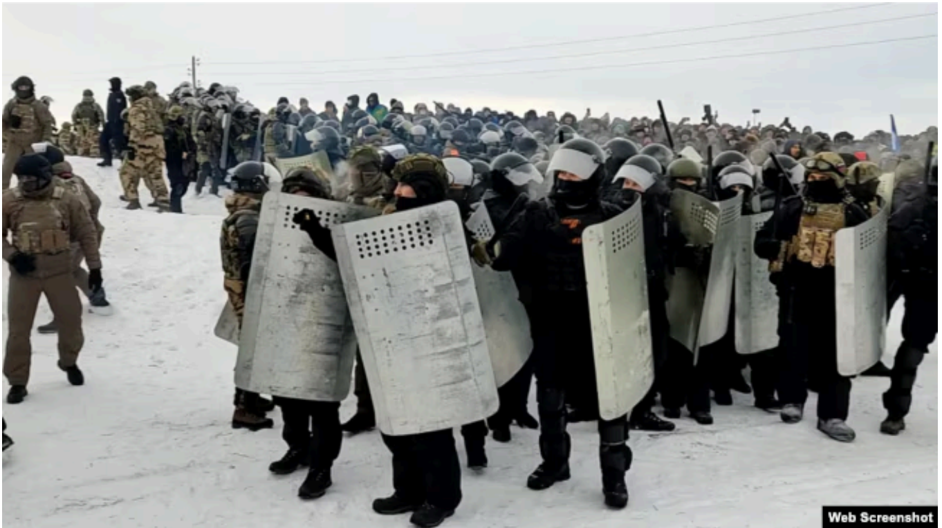
Баймак, 17 января 2024 года

— Все доказательства обвинения строятся исключительно на показаниях сотрудников правоохранительных структур, которые присутствовали на площади, — говорил один из собеседников "Idel.Реалии". — Никаких доказательств того, что обвиняемые или вообще кто-то другой "организовывали массовые беспорядки", нет — ни переписок, ни расшифровок переговоров, которые бы хоть как-то свидетельствовали об этом.