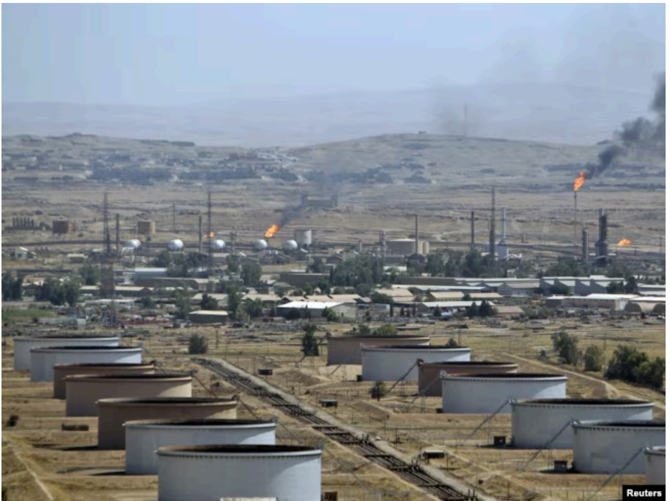
Нефтяное месторождение Баба Гургур в Киркуке, в 250 километрах к северу от Багдада. 2025 год

Кроме того, в апреле Анкара вновь предложила реанимировать проект строительства, в том числе через сирийскую территорию, стратегического газопровода "Катар-Турция-Европа". Турция рассматривает этот маршрут как стратегическую альтернативу поставкам через Ормузский пролив и путь к статусу ключевого энергетического хаба. Впрочем, несмотря на турецкий оптимизм, Катар все еще проявляет осторожность в этом вопросе, так как по-прежнему надеется на возобновление экспорта сжиженного природного газа (СПГ) танкерами через Ормузский пролив.