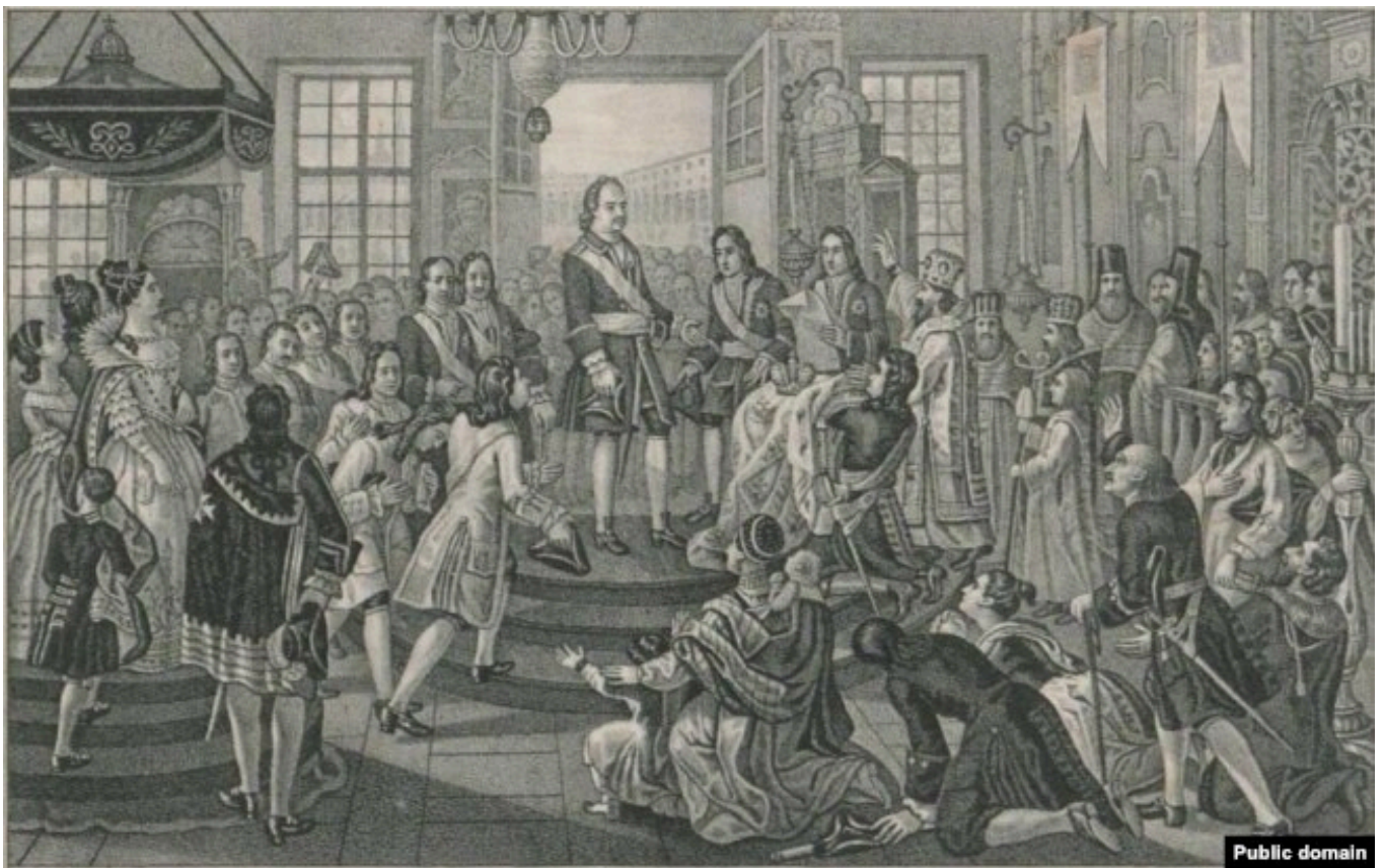
Царя Петра Великого провозглашают императором Всероссийским, октябрь 1721 года. Гравюра XVIII века

Спасение в ходе переговоров пришло в виде османской коррупции. Деньги казны, сотни тысяч рублей, и бриллианты, пожертвованные новой супругой царя Екатериной , смягчили великого визиря Мехмеда Балтаджи. Несмотря на ярость Карла XII, турецкий полководец подписал мирное соглашение. 12 июля 1711 года был заключен Прутский мирный договор, невыгодный для России. Петр I проиграл кампанию сильно, но не безнадежно в масштабе всей Северной войны. В результате переговоров Россия отдавала Османской империи Азов, обещала срыть крепости Таганрог, Богородицк и Каменный Затон. Русская армия свободно ушла в Россию. Русские обязались вывести войска с территории Речи Посполитой (чего, правда, не сделали). Османский султан обещал выслать Карла XII. (Это тоже выполнено в срок не было).