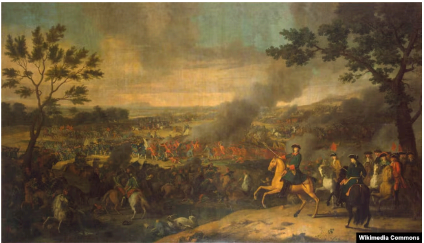
"Пётр I в Полтавской битве", картина Луи Каравака (1718)