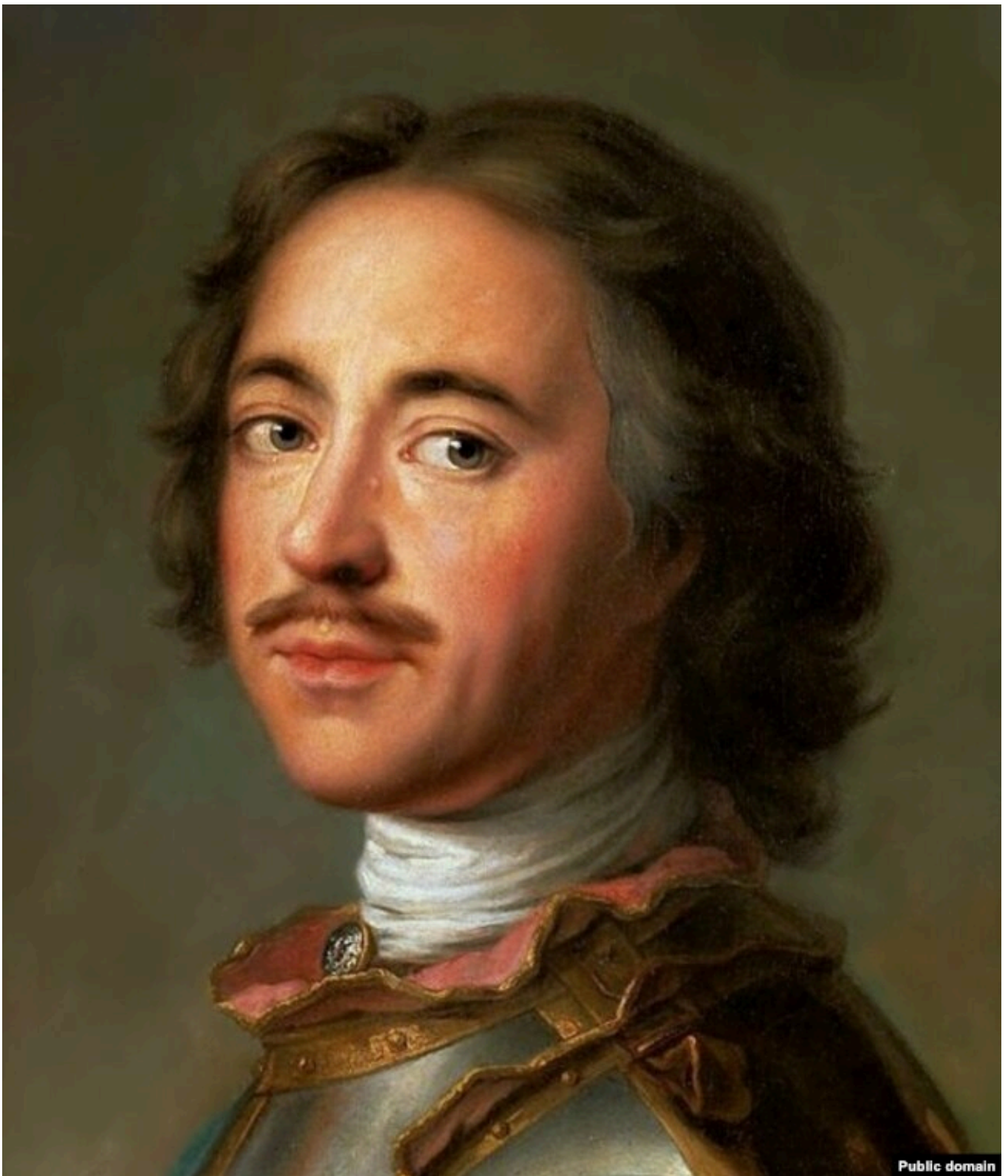
Царь Петр I в 1717 году. Портрет Жан-Марка Наттье