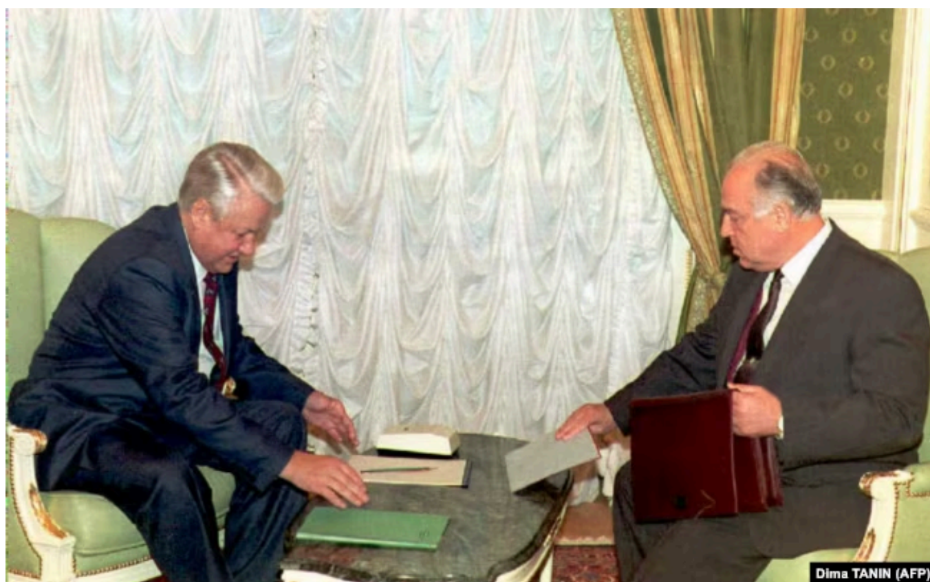
Борис Ельцин и его несостоявшийся преемник Виктор Черномырдин на встрече в Кремле в конце 1994 года

одолжив государству средства (часто поступившие к ним на счета из бюджета), получали в залог контрольные пакеты акций таких стратегически важных компаний, как "Норильский никель", "Сибнефть", "Сургутнефтегаз", ЮКОС и другие. В случае невозврата государством кредита акции через год (то есть после выборов) переходили в собственность олигархов.