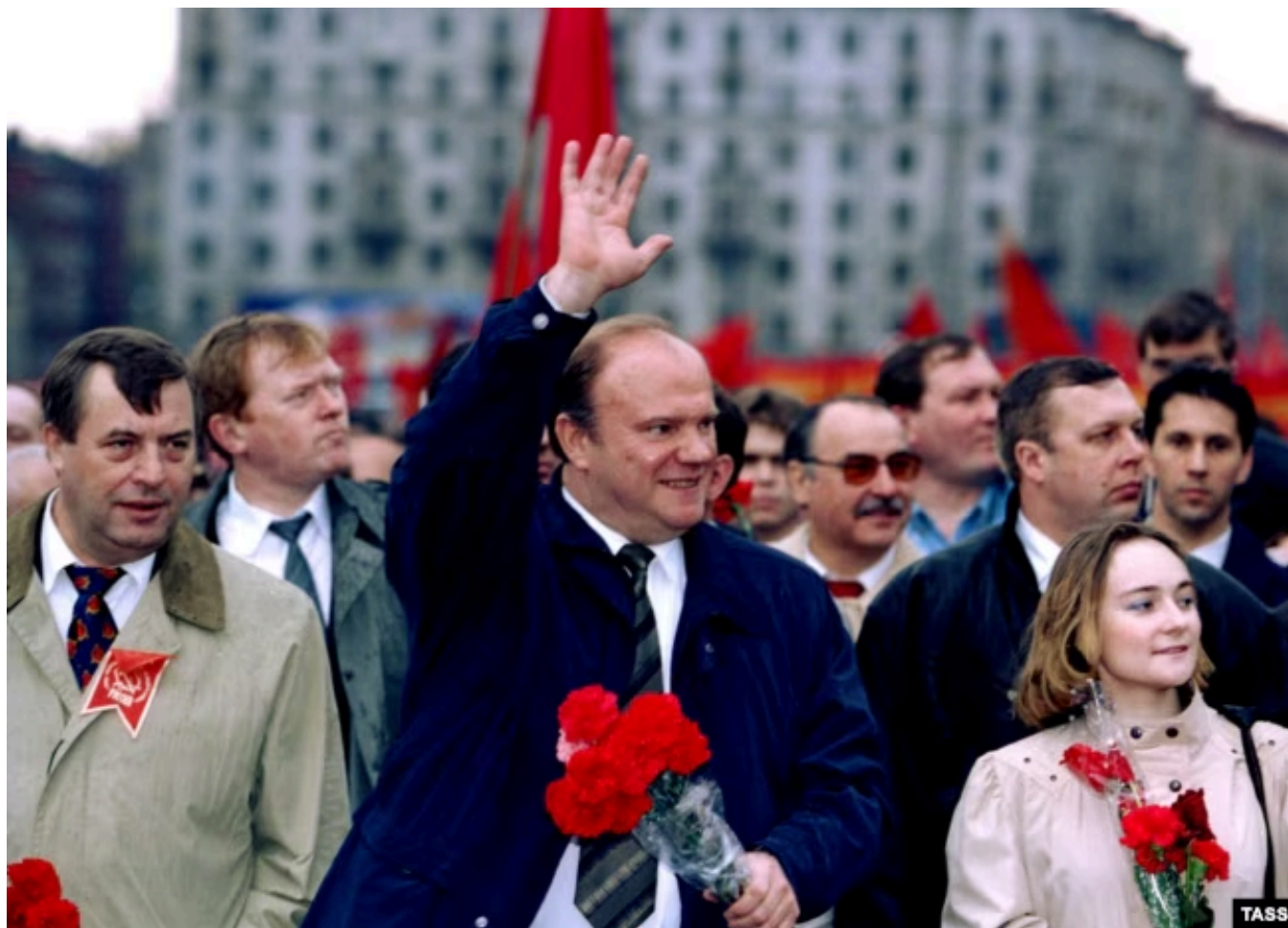
Геннадий Зюганов со своими сторонниками отмечают Первомай 1996 года

старалась представить себя как левоцентристскую силу, что позволило ее выдвигенцам одержать победу примерно в 40 регионах России.