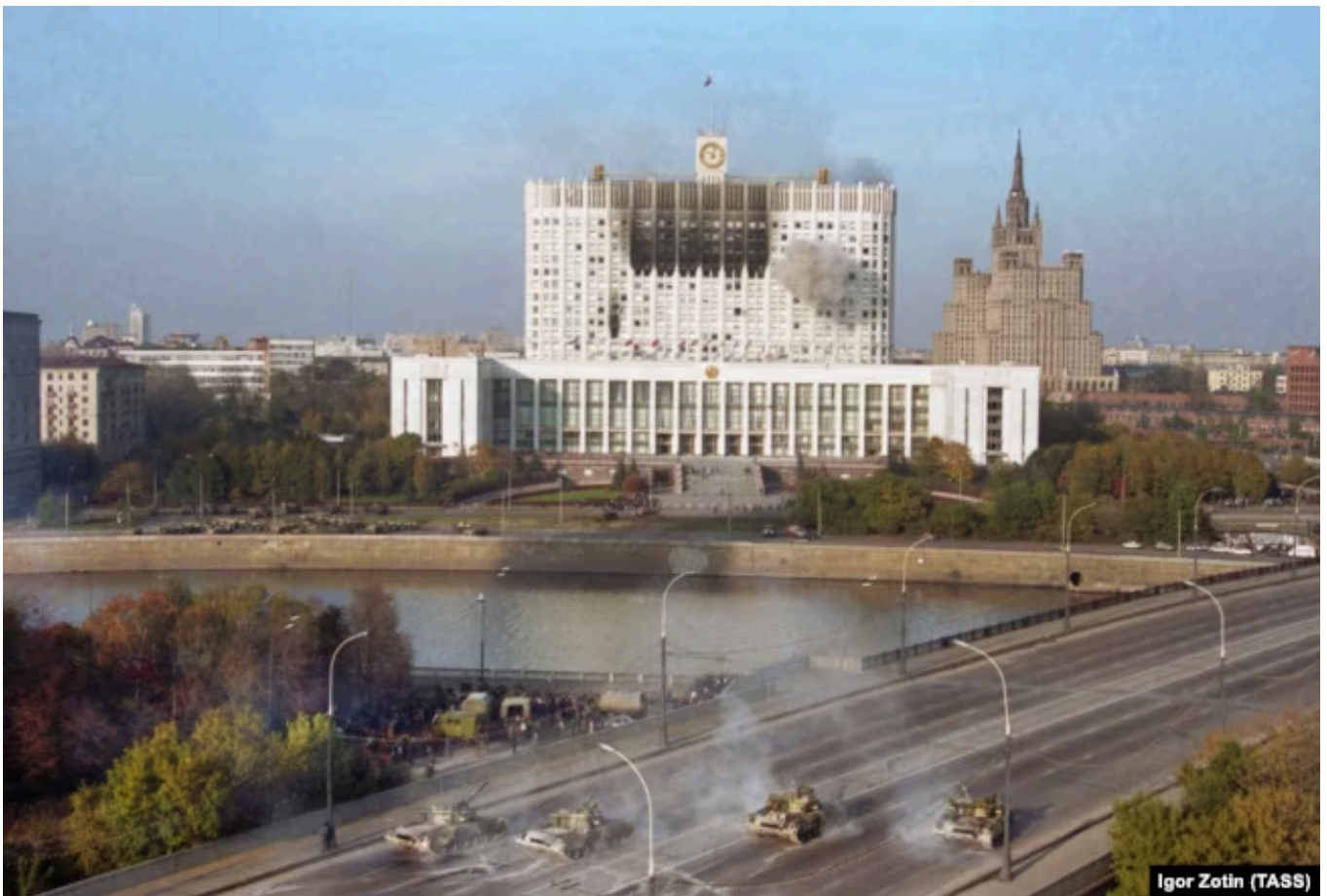
Здание Верховного Совета России после обстрела из танков в начале октября 1993 года

Главным для России политическим событием 1994 года стала первая война в Чечне. Попытки подчинить отделившуюся от центра в 1991 году республику не путем переговоров, а с помощью спецопераций безуспешно делались несколько раз в течение года. Режим генерала Джохара Дудаева неожиданно для Кремля оказался устойчивым. Многим в России казалось, что провозгласившая независимость Ичкерия находится в полном хаосе и не будет способна сопротивляться. Это была грубая политическая ошибка. Министр обороны Павел Грачев , как гласит легенда, обещал "взять Грозный одним полком ВДВ". Активно лоббировал военную кампанию и вице-премьер Николай Егоров .