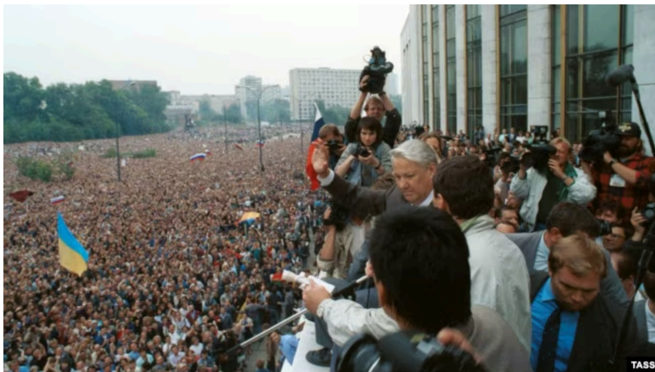
Борис Ельцин выступает на массовом митинге в Москве в поддержку демократии 20 августа 1991 года

Провал путча, который был отчасти побежден вышедшими в Москве на защиту Верховного Совета и президента России десятками тысяч граждан, а отчасти предопределен расколом элит, дал всем республиканским властям возможность брать власть в свои руки и реформировать экономику, как это фактически сделал Борис Ельцин, или выходить из состава Союза, как поступило руководство Украины и других республик. СССР умер уже после 22 августа 1991 года, когда участники заговора ГКЧП были арестованы, а на пространстве страны вместо союзных республик сформировались новые государства.