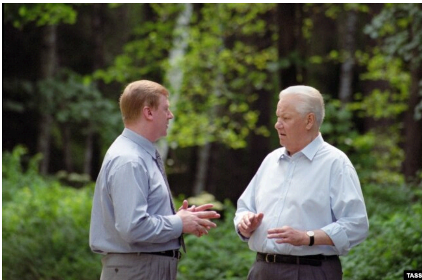
Борис Ельцин и один из главных архитекторов его победы в 1996 году Анатолий Чубайс. Фото 1998 года

Подчеркивая свое особое положение, президент Ельцин ни разу не принял участия в организованных на телевидении теледебатах. Более половины всего информационного телеэфира федеральных каналов (53%) было посвящено кампании действующего президента, причем все ее освещение было позитивным.