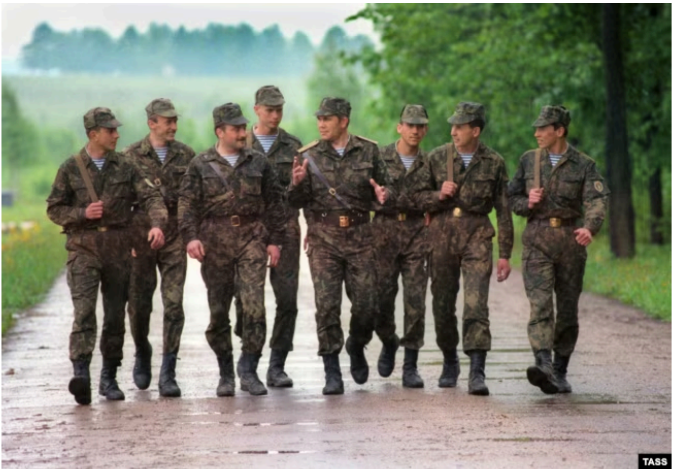
Генерал Александр Лебедь (четвертый справа) с солдатами-десантниками, 1992 год

Все чаще возникало впечатление, что команда Коржакова готова подвести Ельцина к необходимости решения об отмене выборов. Положение официального штаба в марте ухудшилось. Конкуренты доказывали, что Олег Сосковец плохо организовал сбор подписей за выдвижение, в них было много брака. Помощники Ельцина Виктор Илюшин, Георгий Сатаров и другие написали президенту жалобу, обвиняя Сосковца в "бесплодном администрировании". Они указывали, что президента "затаскивают в ситуацию, когда он будет вынужден либо отменить выборы, либо аннулировать их результаты".