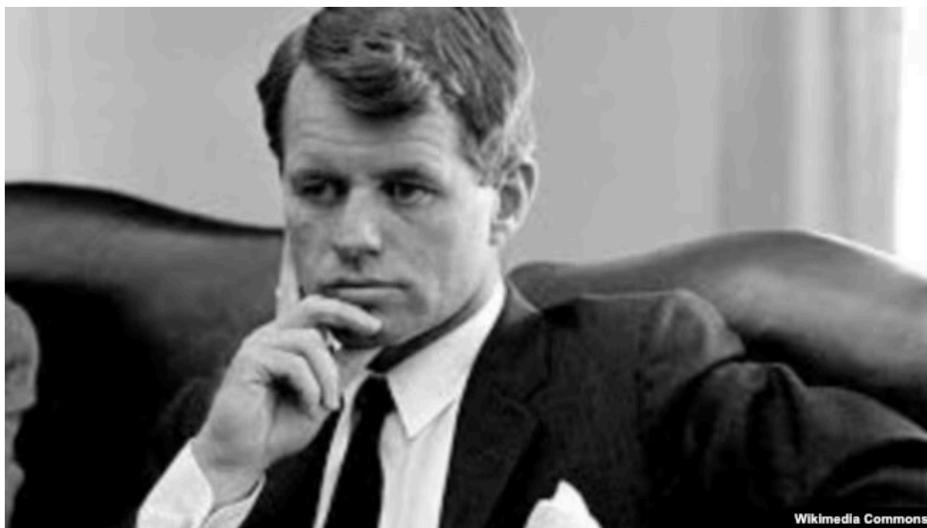
Роберт Кеннеди в 1968 году

Когда Кеннеди вернулся в Соединенные Штаты, его поездка по закрытой для внешнего мира стране привлекла широкое внимание. Политическая карьера политика пошла в гору, как и карьера его старшего брата Джона, будущего президента.