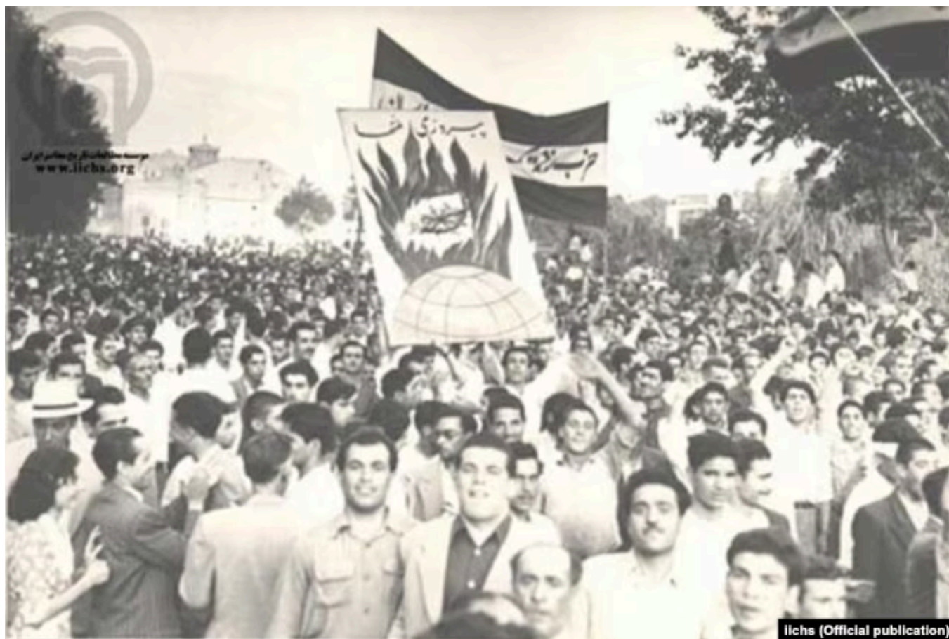
Массовые протесты в Тегеране в 50-е годы XX века

Через несколько месяцев после поддержанного США и Великобританией переворота в Иране 1953 года , свергнувшего премьер-министра Мохаммеда Мосаддыка (Моссадега), Флотт был направлен политическим офицером в посольство США в Тегеране. По его словам, в Иране в то время советские агенты пытались спровоцировать беспорядки.