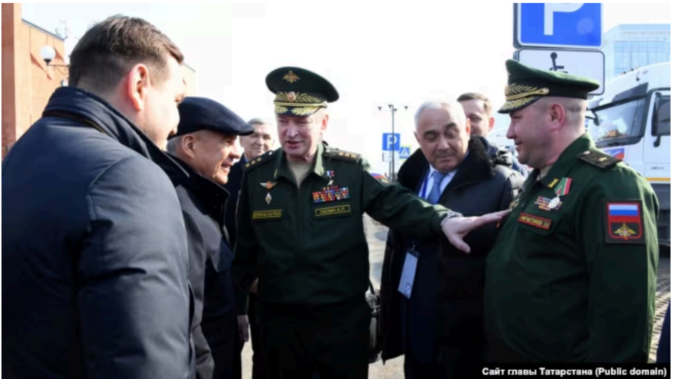
Александр Лапин и Рустам Минниханов. Март 2026 года

По мнению политолога, Лапин для поста депутата Госдумы "подходит по нескольким пунктам", в том числе как "герой войны", поскольку для них, "как известно, есть квоты".