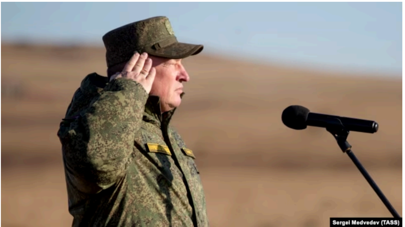
Александр Лапин. Архивное фото

В январе 2023 года Лапин стал начальником Главного штаба сухопутных войск, а в марте 2024-го возглавил воссозданный Ленинградский военный округ. В тот же период была сформирована группировка "Север", отвечающая за харьковское и курское направления.