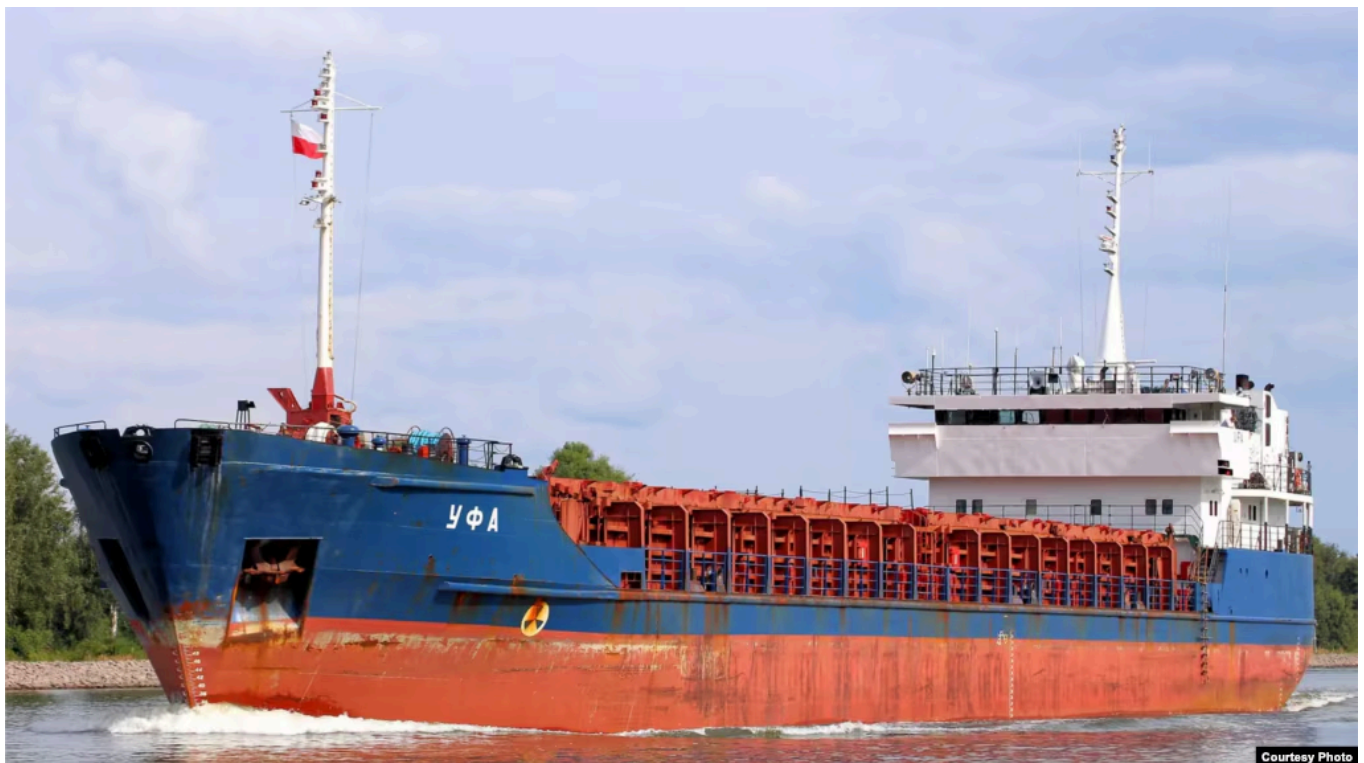
Сухогруз Caffa в 2021 году

Суд в Швеции наложил арест на судно Caffa, которое могло участвовать в незаконном вывозе украинской продукции занятых российской армией территорий. Это первый случай, когда иностранный суд принял такое решение по просьбе украинской прокуратуры, сообщил генпрокурор Украины Руслан Кравченко.