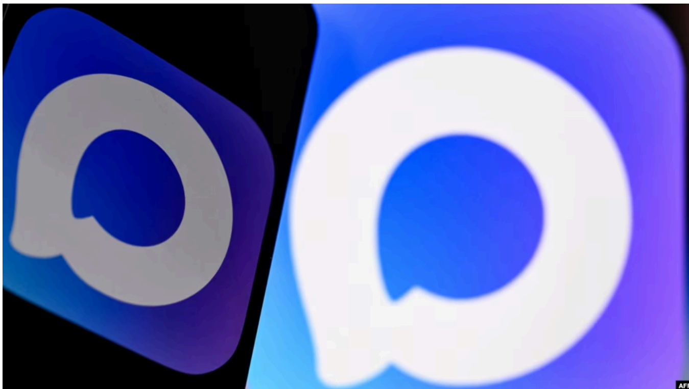
Логотип мессенджера Max

Российский национальный мессенджер Max исчез из магазина приложений App Store.