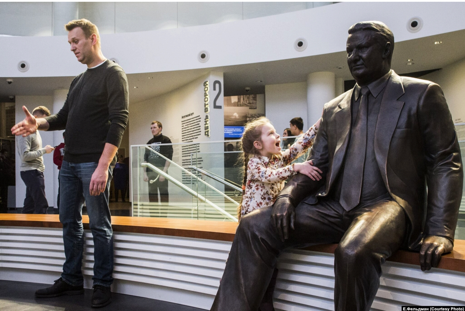
Навальный во время президентского турне

Или в "Ельцин-центре" был кадр, где к Алексею выстроилась целая очередь людей, которые хотели пожать руку, сфотографироваться. И я снимал Навального, протягивающего руку в край кадра. В другой половине кадра была девочка, которая с восторгом в глазах ползала по бронзовой скульптуре Ельцина.