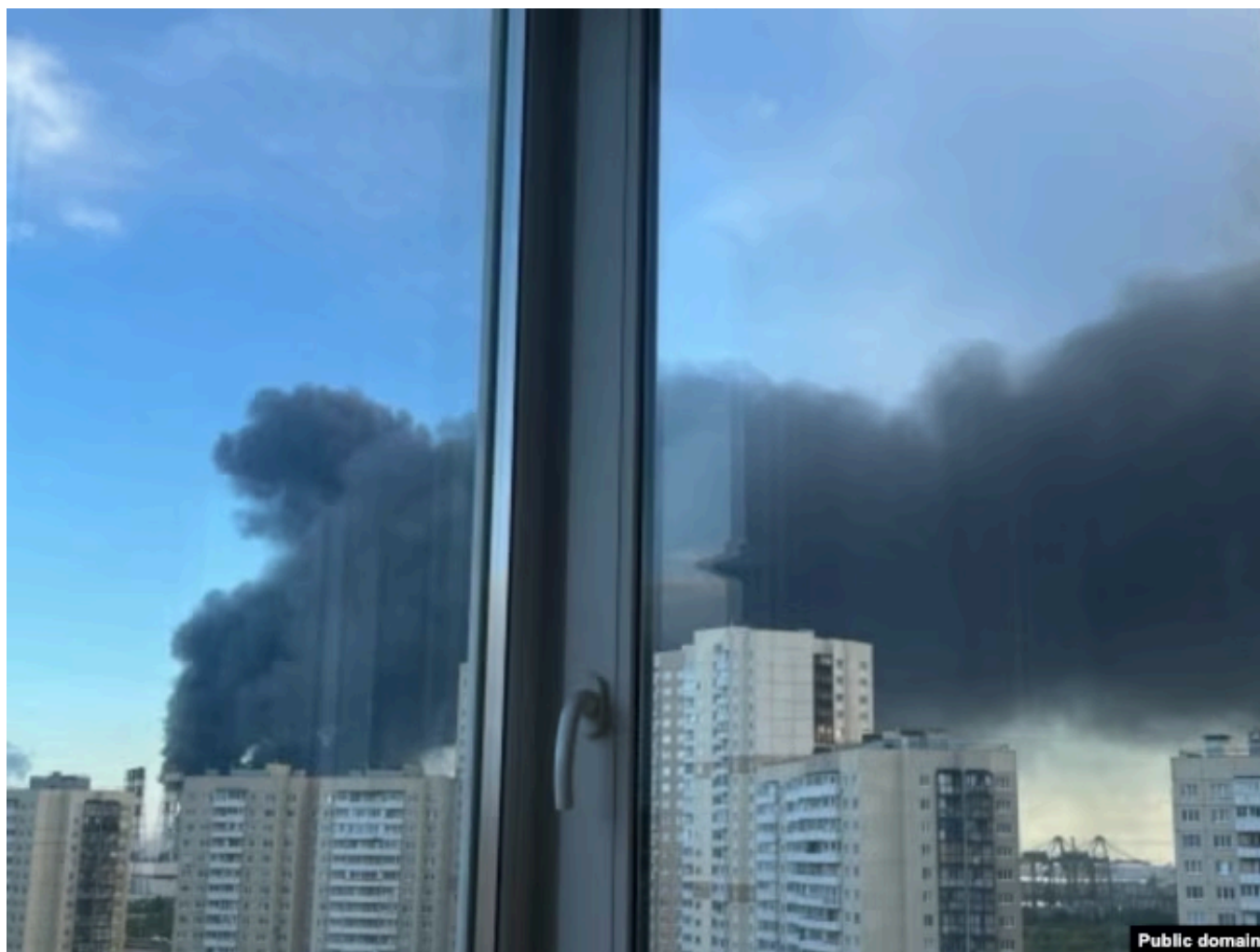
Атака дронов, Петербург, 3 июня 2026 года