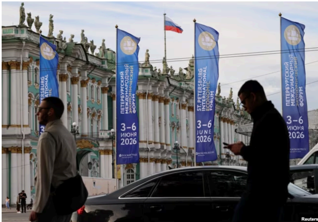
ПМЭФ, фотография сделана 2 июня 2026 года

В Пулково сообщили, что к восьми часам утра более чем на два часа задержано 42 рейса, еще двенадцать ждут вылета с запасных аэродромов. "Обстановка в терминалах спокойная", – объявила пресс-служба аэродрома.