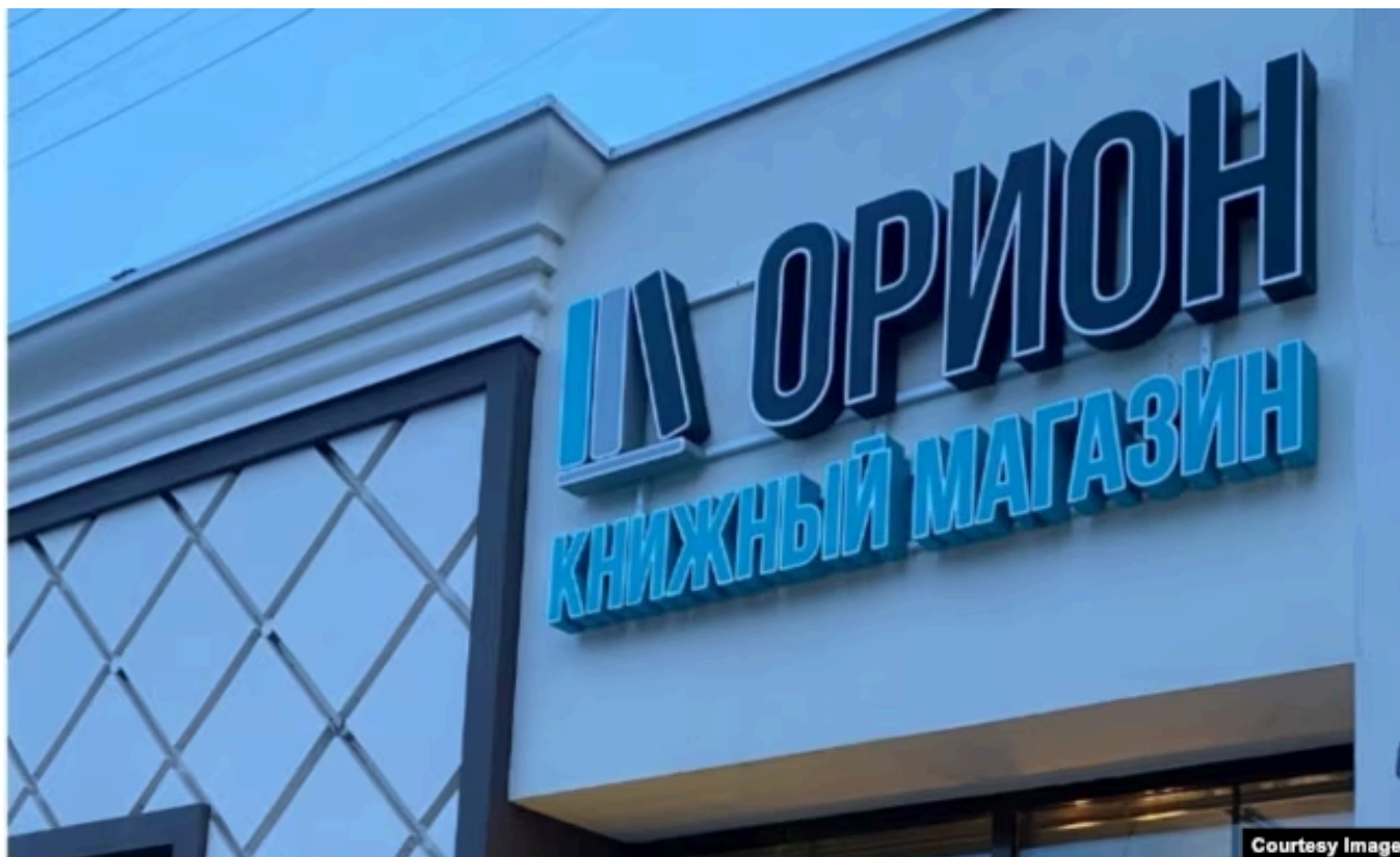
Книжный магазин "Орион"

работать". Однако в комментариях к сообщению о закрытии магазина люди прямо говорят о том, почему принято такое решение.