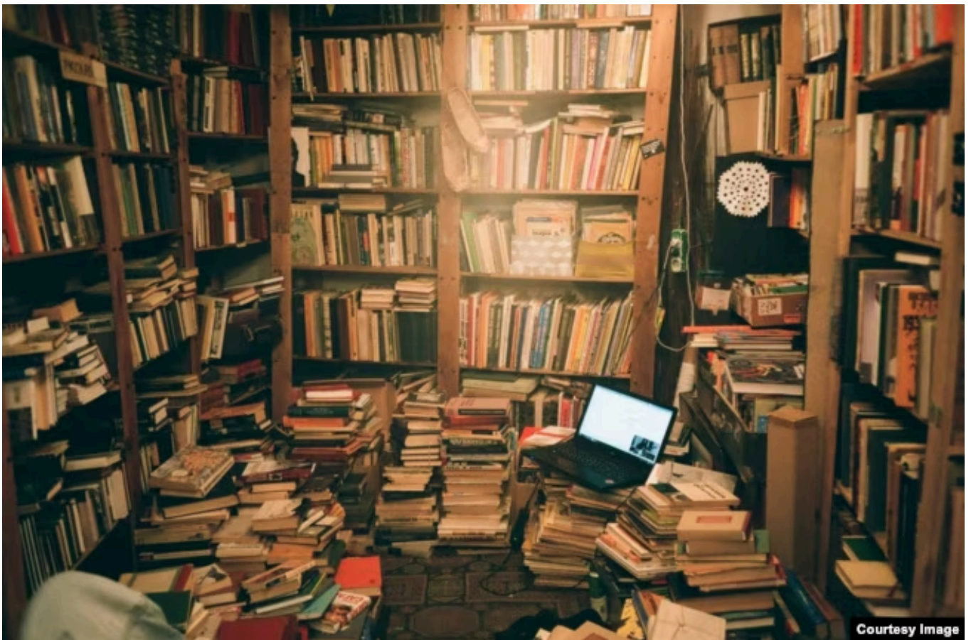
Книжный магазин "Ходасевич"

Ситуацию последних месяцев Федор называет "буйством абсурда".