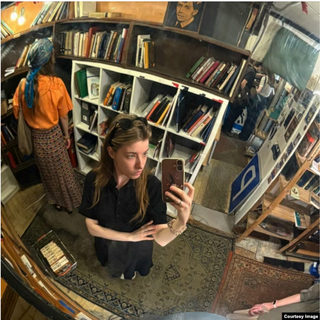
Книжный магазин "Ходасевич"

– Сначала речь шла об иноагентах, а прошлой осенью запретили уже любые книжки, допустим, Быкова или Гениса. Первое время еще можно было продавать с пометкой, потом уже вообще никак. А дальше всё пошло в разнос, начали искать наркотики и всякое ЛГБТ – если Анна Каренина принимала морфий, нужно наклейку клеить: наркота в книжке присутствует. То есть цензура окончательно оборзела. Как говорил Шкловский, "Уступая дорогу трамваю, мы делаем это не из вежливости". Если хочешь работать в этих условиях, надо соблюдать все правила. И если издательство присылает список книг, снимаемых с продажи, то не снять их – это глупая фронда: для независимого книжного штраф в 600 или 800 тысяч – половина годового оборота, ее неоткуда взять. Короче, или ты выполняешь законы, какие бы они ни были – или закрываешься.