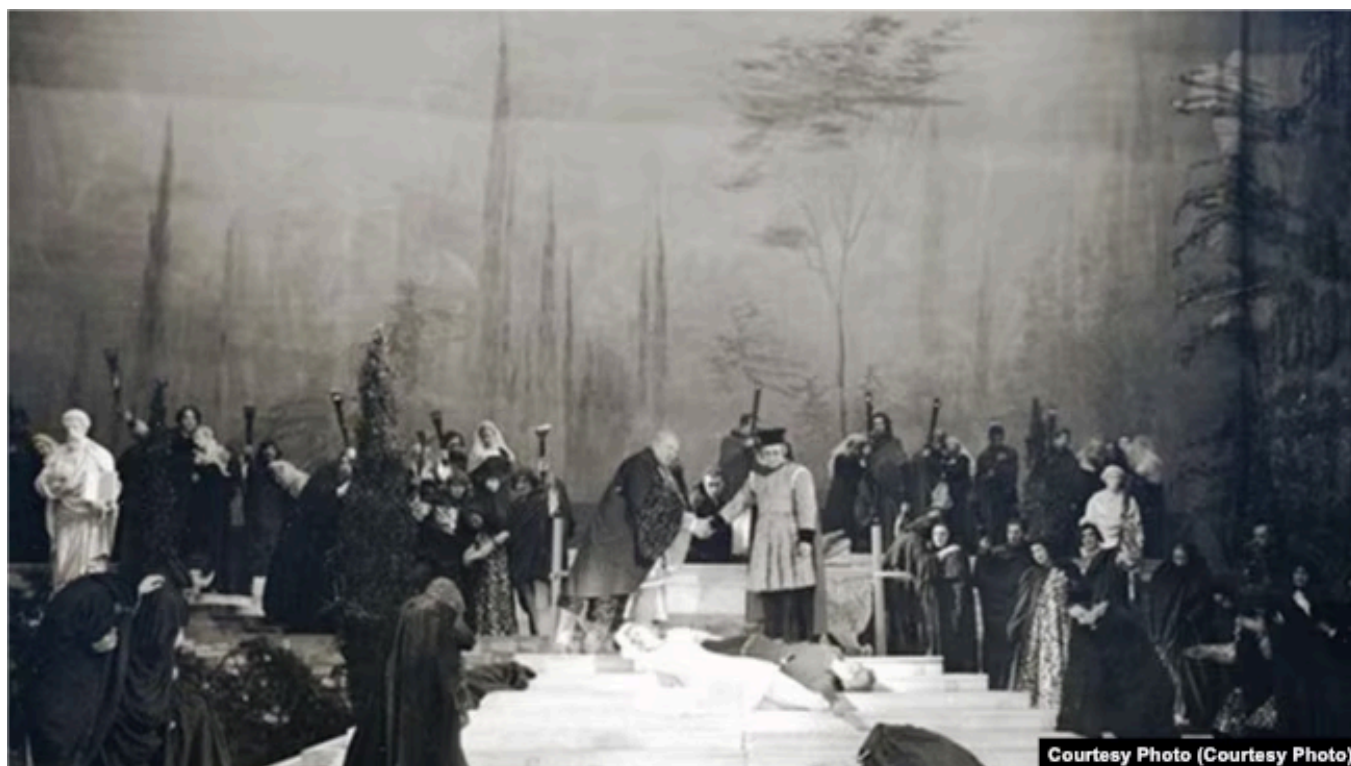
Финал балета "Ромео и Джульетта", 1940 год

Балет "Ромео и Джульетта" сразу стал казаться не просто сложным, а подозрительным. Слишком много экспериментов. Слишком несоветская интонация. Слишком самостоятельные и непредсказуемые творцы. Прокофьев и его соавторы изменили сценарий и ввели традиционный трагический конец. Но сначала Кировский театр, а потом и Большой отказались выпускать спектакль и разорвали договоры на постановку. Через год, в 1937-м, у Прокофьева не примут и совершенно верноподданную "Контату к 20-летию Октября" (в которой должны были звучать тексты Маркса, Ленина и Сталина). Музыка и замысел покажутся цензорам также подозрительно сложными.