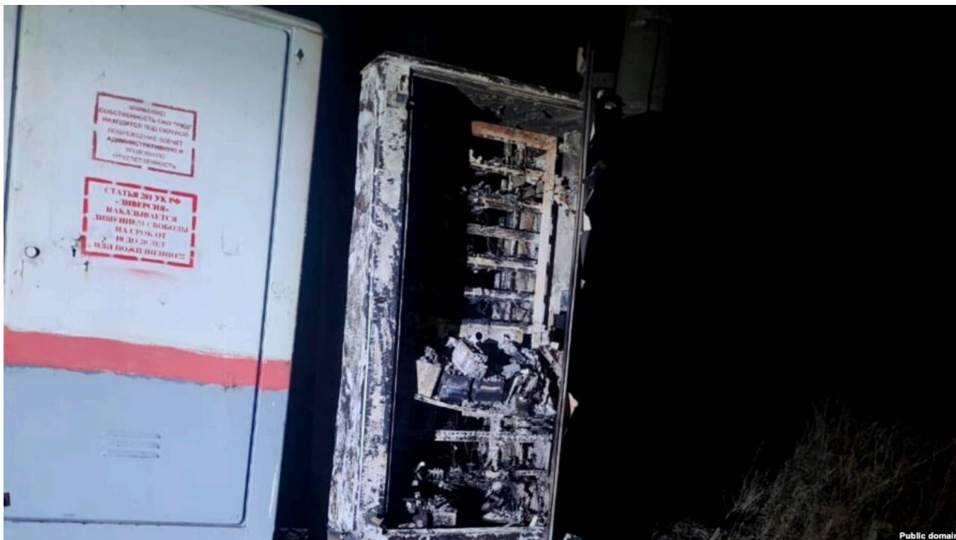
Сгоревший релейный шкаф

С начала российского полномасштабного вторжения в Украину 24 февраля 2022 года российскими властями были задержаны не менее 240 несовершеннолетних по подозрению в атаках на объекты инфраструктуры, главным образом не железной дороге. Об этом пишет "Медиазона" , которая изучила данные судов и сообщения в медиа об уголовных делах против подростков.