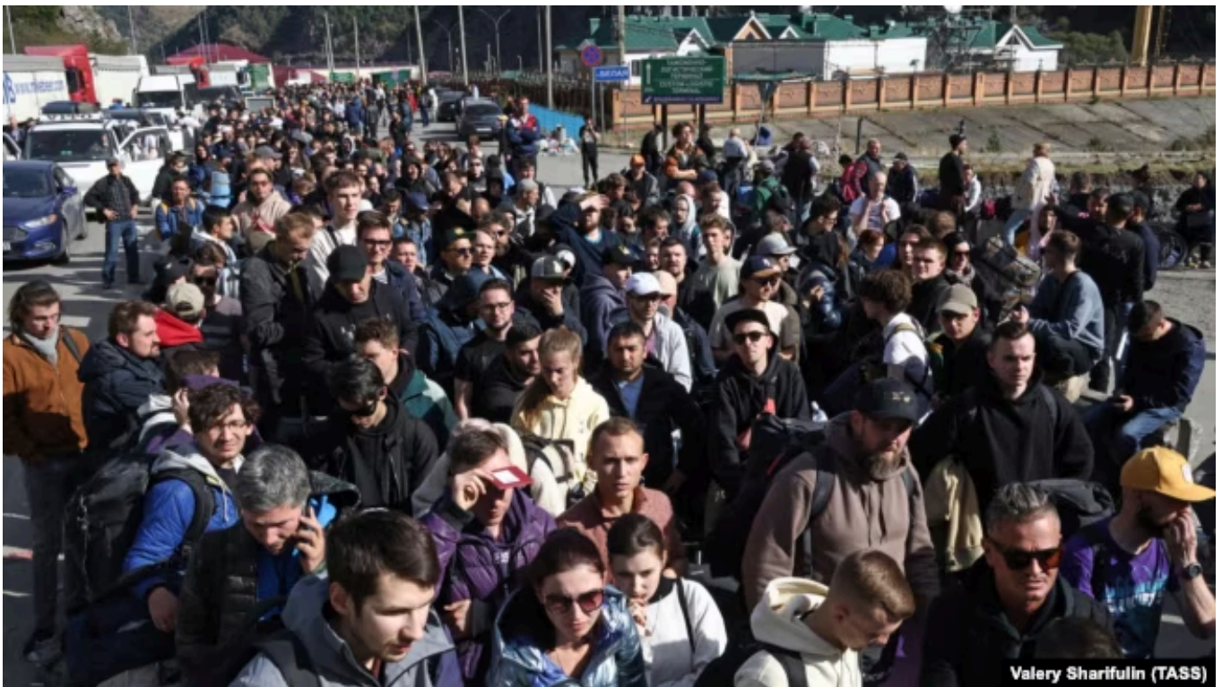
Люди на КПП "Верхний Ларс" на российско-грузинской границе, сентябрь 2022 года