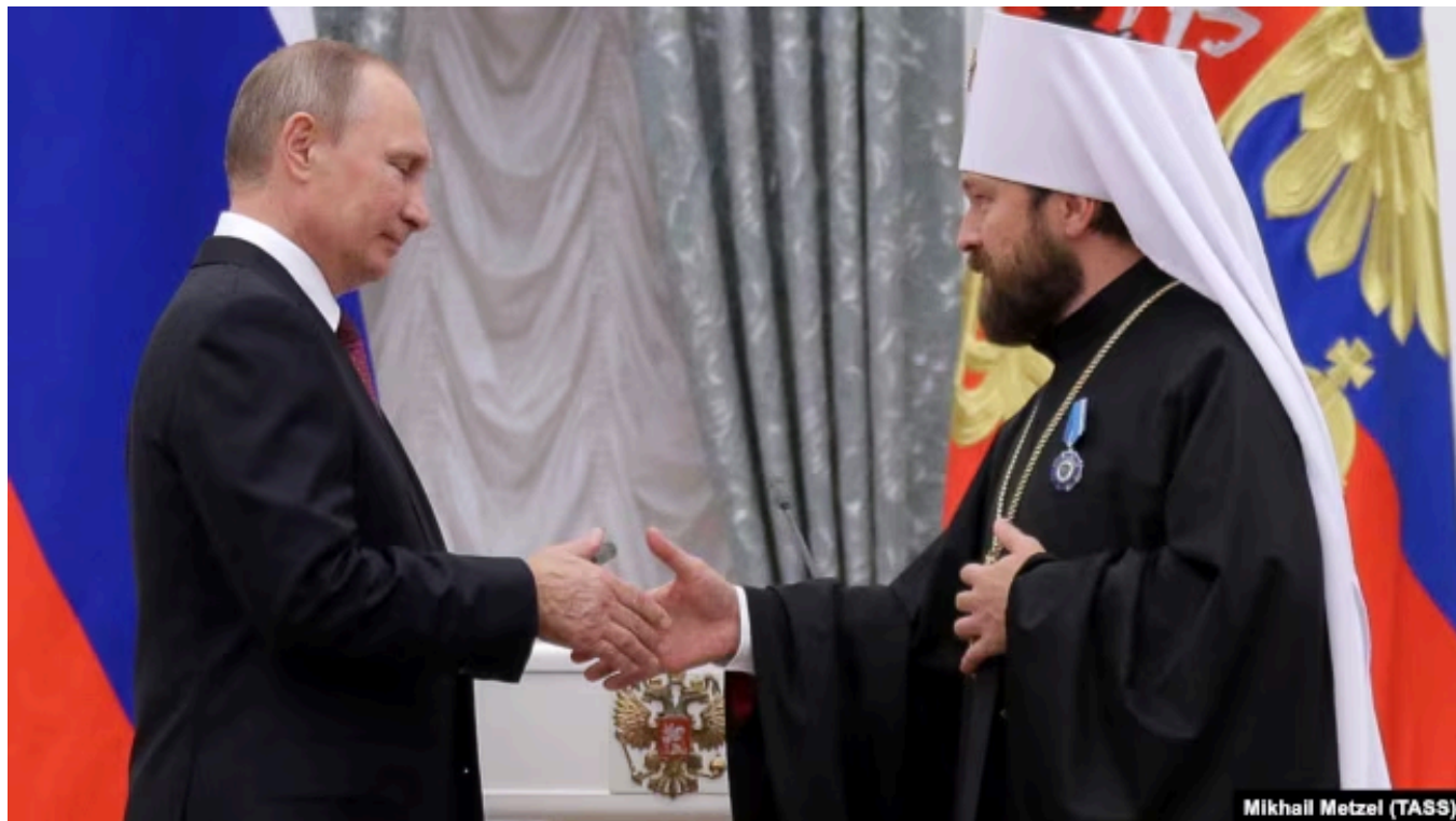
Награждение митрополита Илариона орденом Почета в Кремле, 22 сентября 2016 года