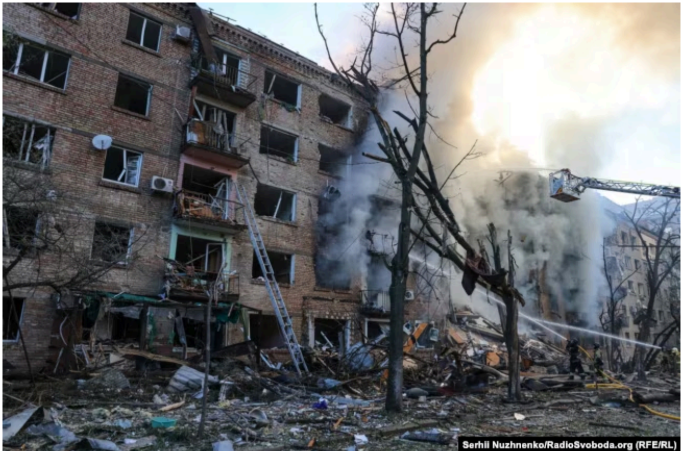
Разрушения в результате российской атаки на Киев. 24 мая 2026 года

– Тройку нельзя будет судить даже заочно, то есть нужно будет ждать до окончания полномочий, а всех остальных заочно можно будет судить. Можно будет готовить расследование.