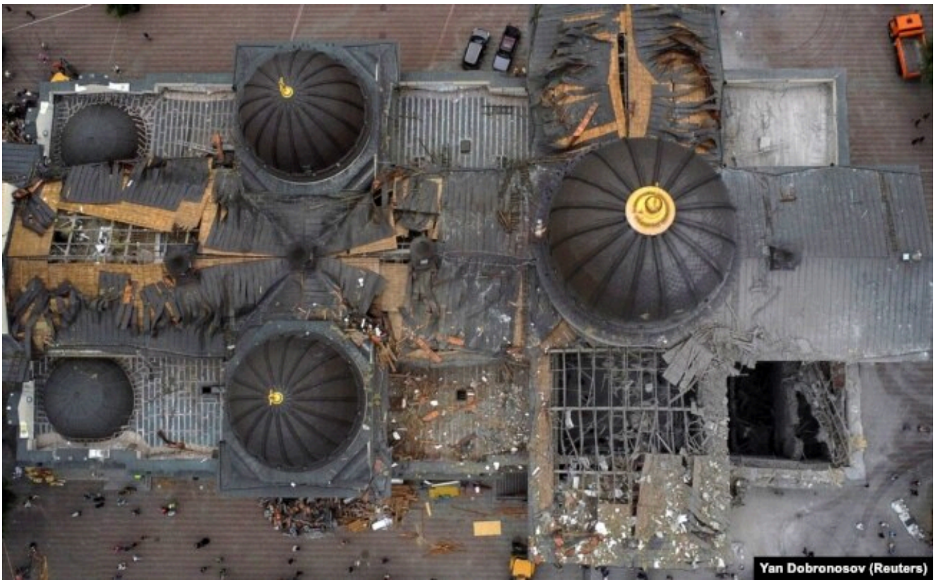
Поврежденный во время российского ракетного обстрела Спасо-Преображенский собор в Одессе, 23 июля 2023 года