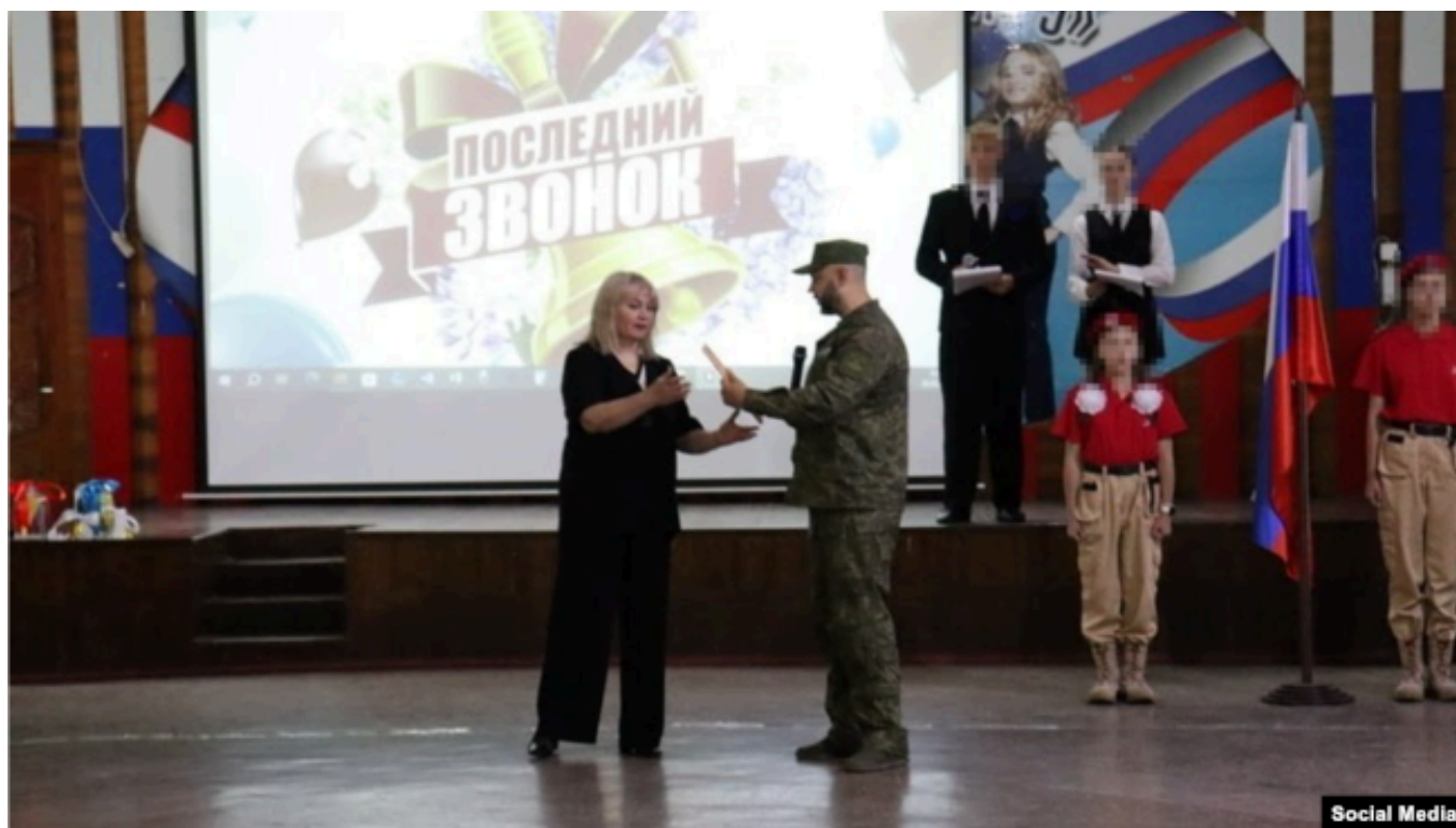
Последний звонок в Лицее №3 города Шахты Ростовской области

В Шахтах Ростовской области родители и учителя организовали акцию "Помощь бойцам СВО вместо букетов": они отказались от покупки цветов, а деньги передали на покупку техники в штурмовой отряд.