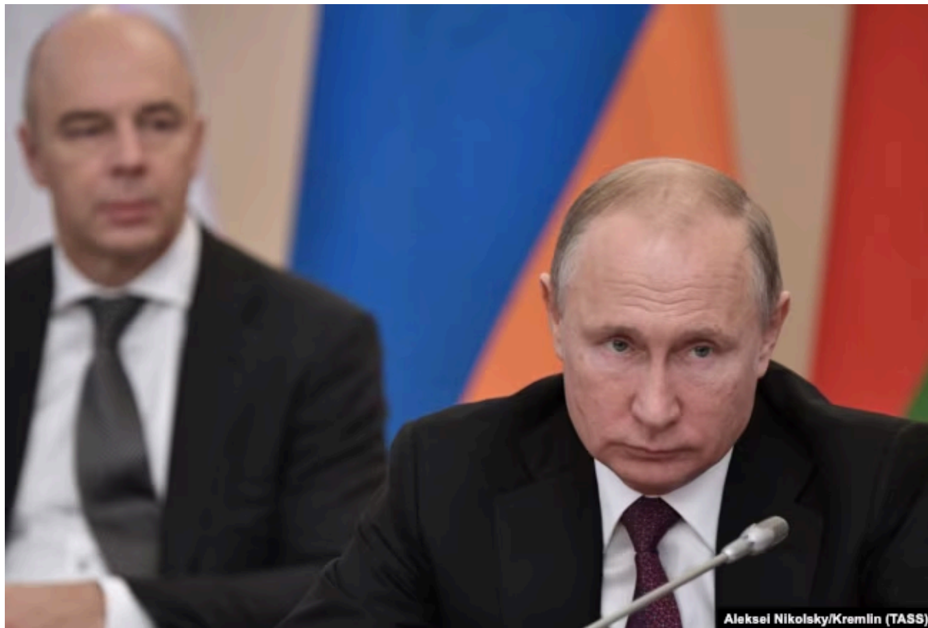
Владимир Путин и Антон Силуанов

“ Никто из них вообще не ждет никакого притока в российскую экономику нефтедолларов