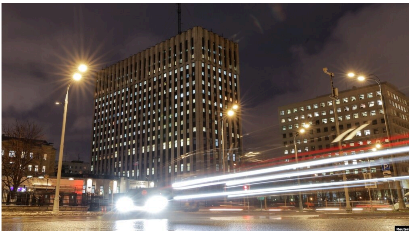
Здание Минюста в Москве