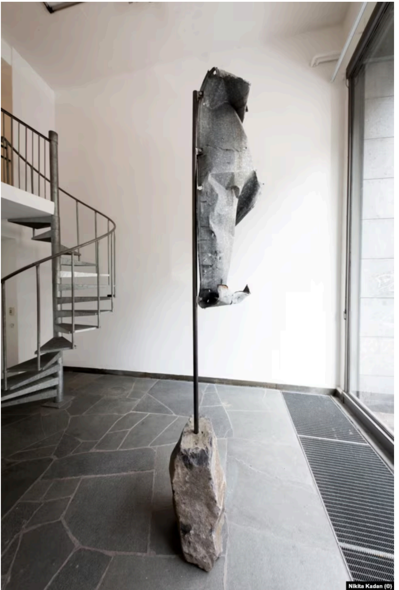
"Гостомельская скульптура" (2022)