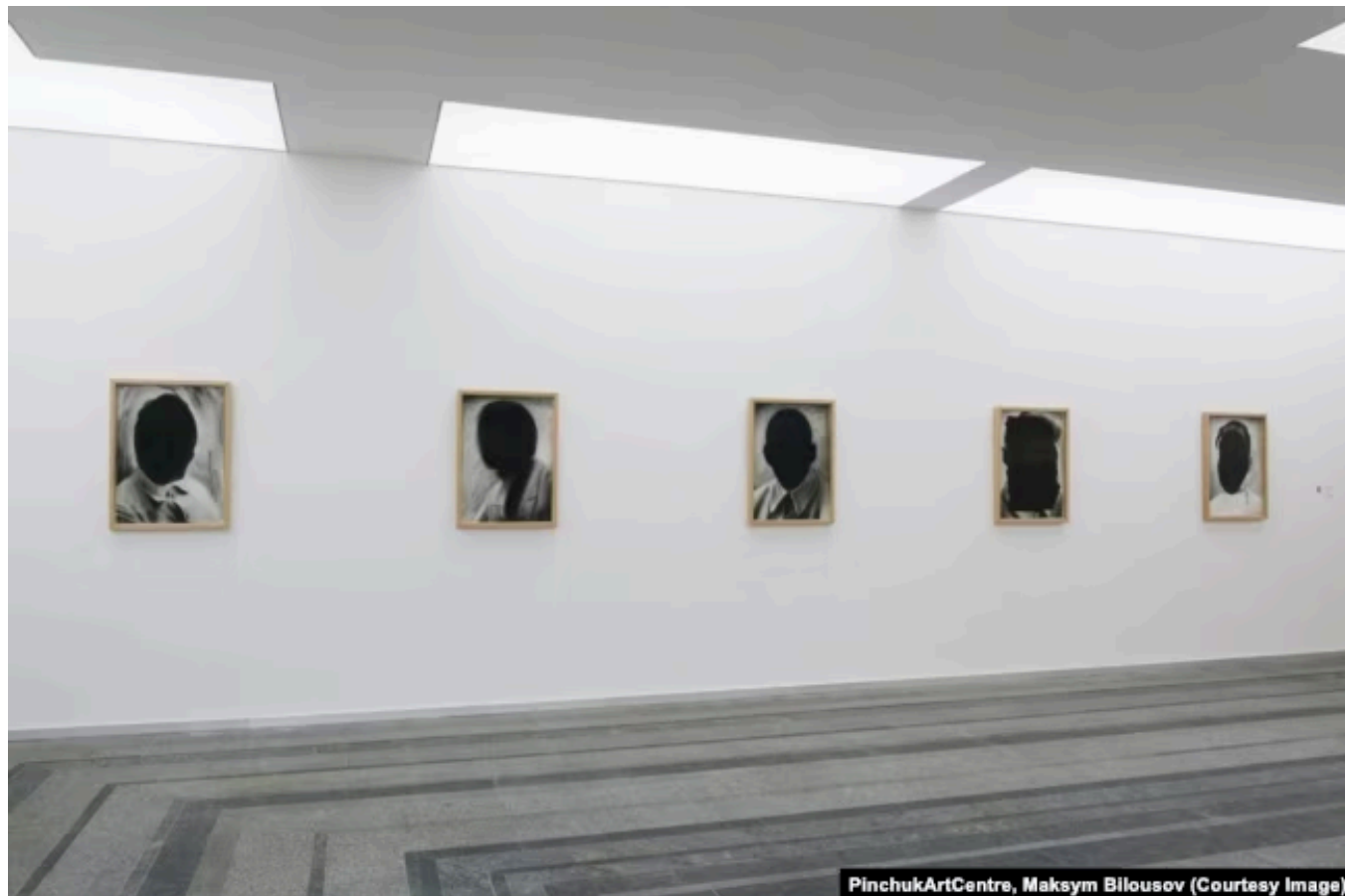
"Зрители" (2016). Фрагмент экспозиции «Камень бьёт камень».