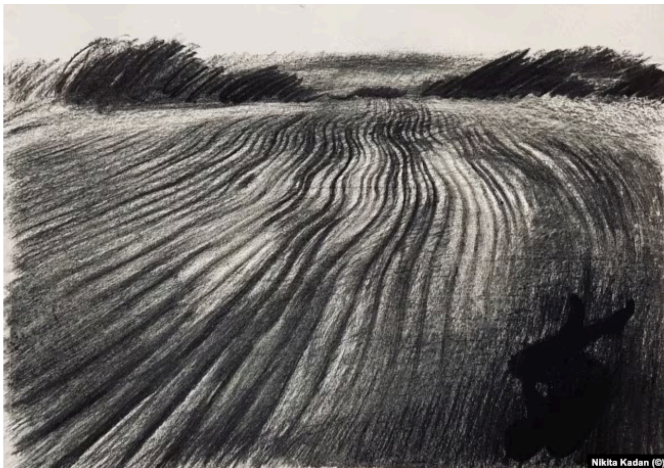
Из серии "Тень на земле" (2022)