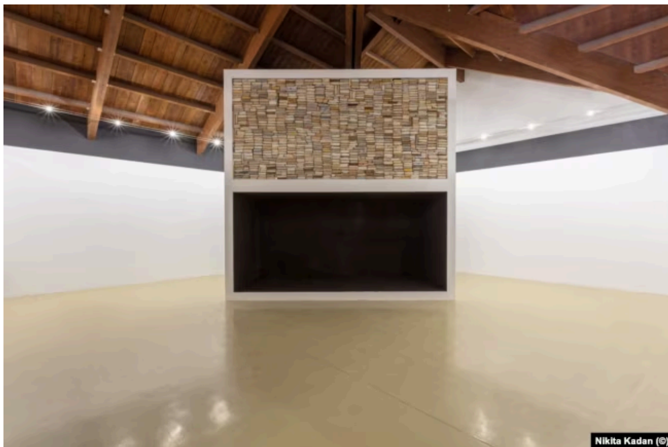
"Убежище II" (2022-2023)

– Во второй работе уже ничего не прорастает. Это необратимость.