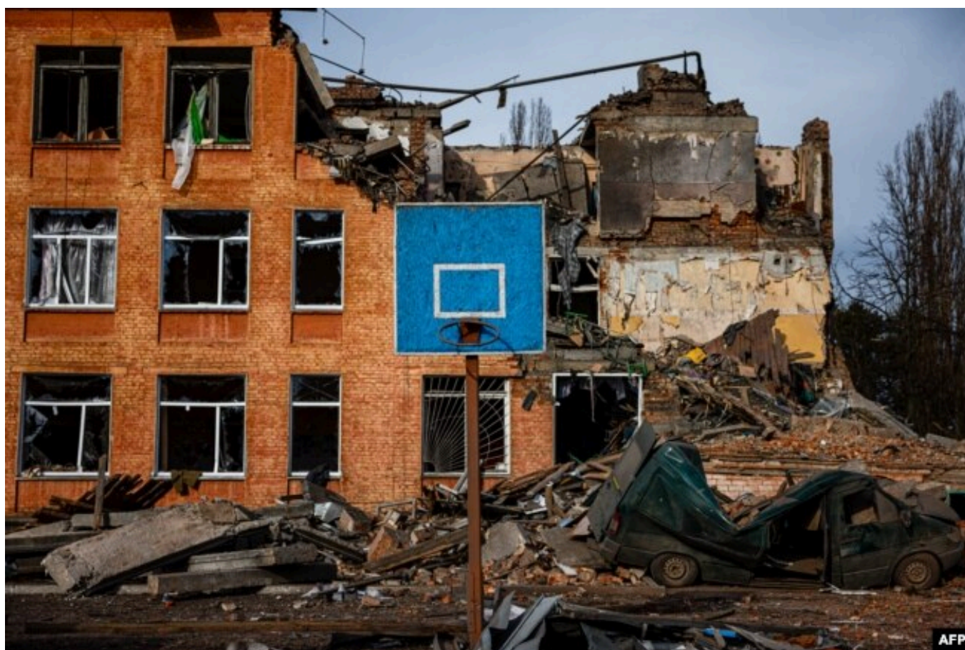
Разрушенная обстрелом 3 марта 2022 года школа в Чернигове

Помимо этого, зафиксировано не менее 3745 случаев разрушения или повреждения объектов культурной, религиозной и социальной инфраструктуры, в частности, исторических памятников, храмов, больниц, образовательных и научных учреждений. Более 17 тысяч обстрелов были направлены по гражданским объектам: жилым домам, предприятиям, школам, детским садам и другим сооружениям.