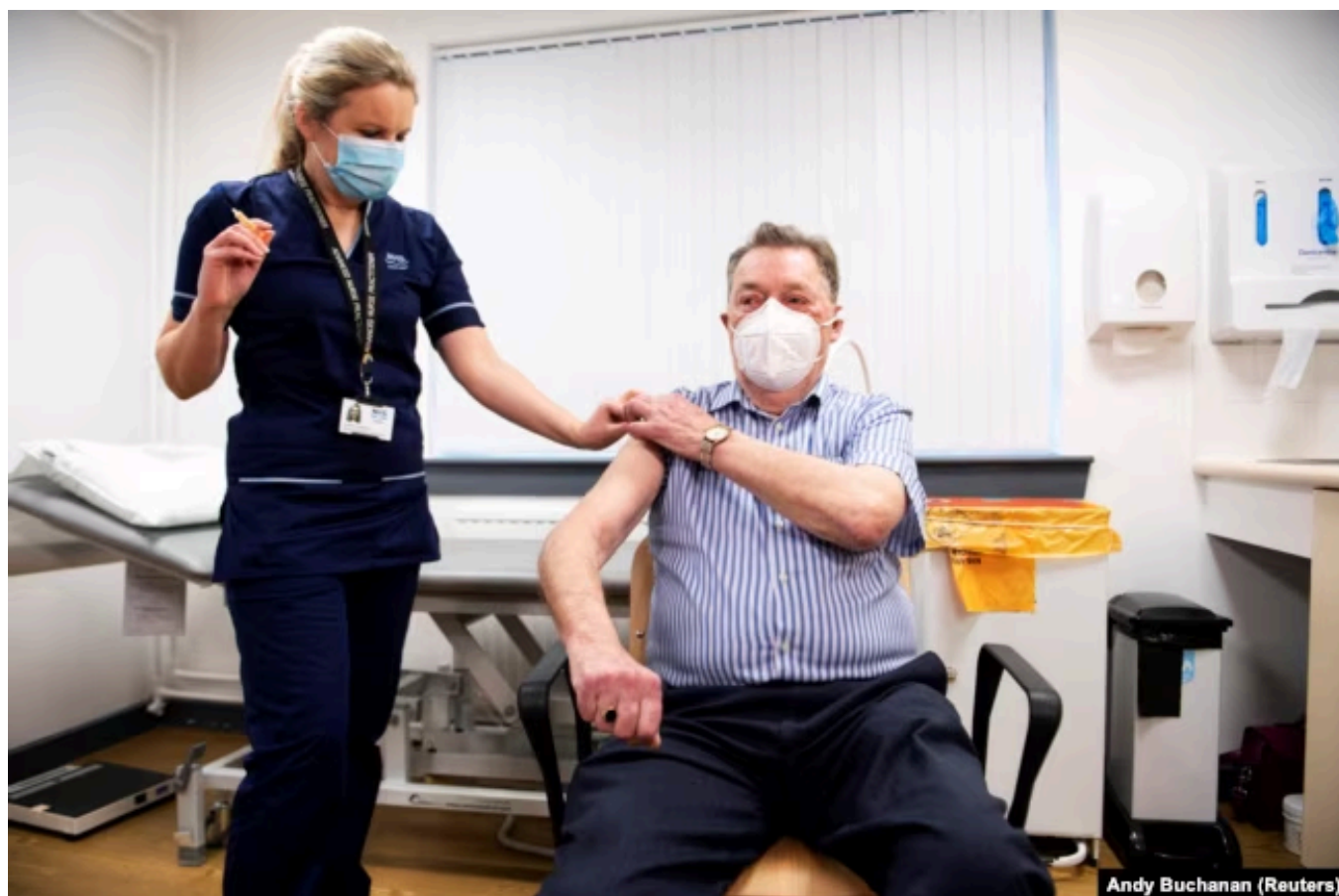
Вакцинация в Ирландии

Первые дозы одобренной в США и Европейском союзе вакцины компаний Pfizer и BioNTech были распределены еще в конце декабря, но из-за небольшого числа доз и низкой температуры хранения – при минус 70 градусах – она доступна пока лишь для медицинских работников, пожилых и людей, деятельность которых стратегически важна для государства. Евросоюз заказал вакцину для 150 миллионов жителей, однако поставки будут осуществляться постепенно на протяжении всего 2021 года. Сколько вакцин уже получили страны ЕС, пока неясно. Если в Великобритании привили уже более миллиона человек (нет информации о том, одной или двумя дозами), то Чехия, к примеру, пока получила вакцину для приблизительно 30 тысяч человек. В то же время обещают, что после того, как будет отлажена логистика, новые дозы будут поставлять каждую неделю. Во многих странах ЕС уже опубликованы графики вакцинации. Основная часть вакцин будет доступна не раньше конца весны этого года, и это при условии, что будет одобрен для широкого использования еще один препарат – компании AstraZeneca.