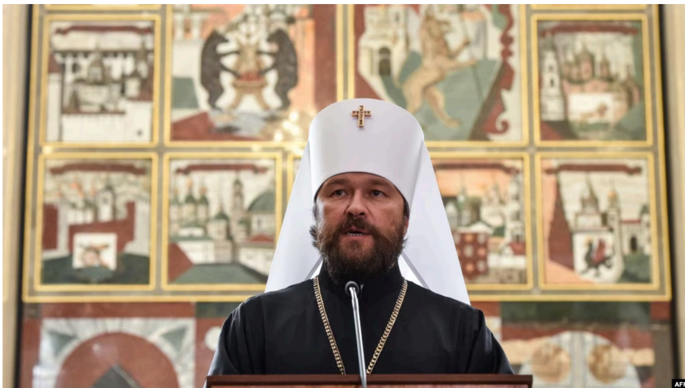
Митрополит РПЦ Иларион (Алфеев)

Экс-глава отдела внешних церковных связей Московского патриархата РПЦ митрополит Иларион (Алфеев), задержанный в Чехии три дня назад, 27 мая был освобожден из-под стражи. Об этом священнослужитель сообщил российскому государственному информагентству ТАСС, уточнив, что он покинул Чехию после того, как был задержан и освобожден без предъявления обвинений.