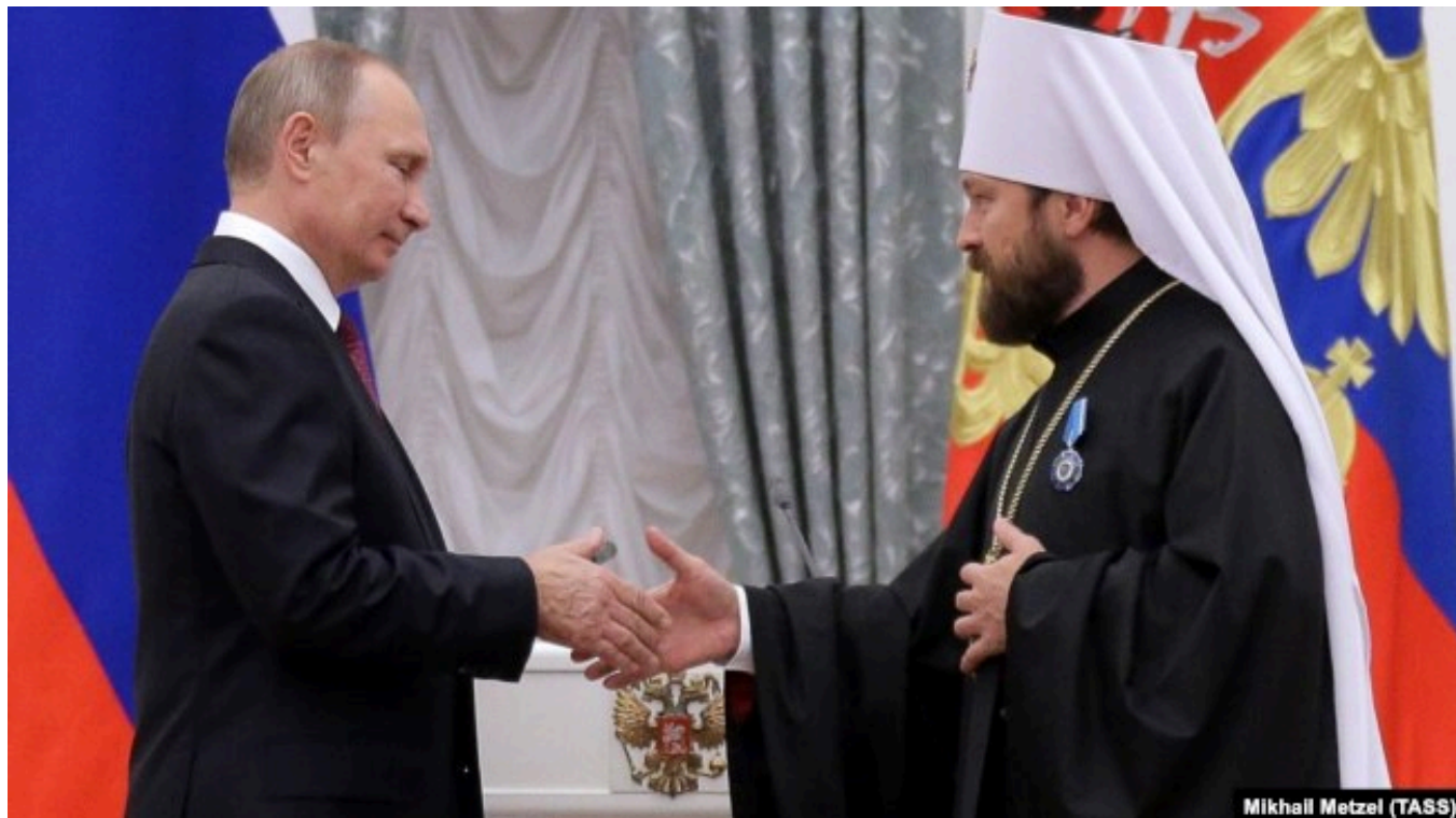
Награждение митрополита Илариона орденом Почета в Кремле, 22 сентября 2016 года