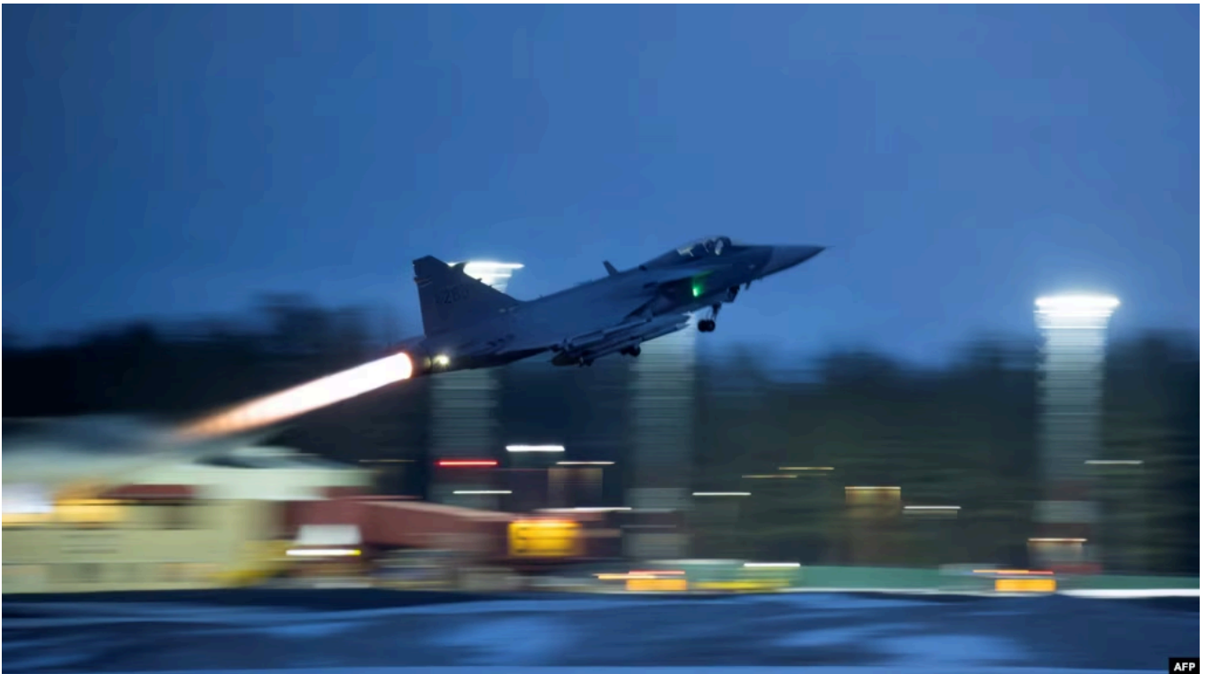
JAS 39 Gripen C/D

Украина планирует закупить у Швеции до 20 новейших истребителей Gripen, а Стокгольм собирается передать Киеву 16 более старых моделей для усиления противовоздушной обороны страны. Об этом было объявлено в четверг в ходе визита в Швецию президента Украины Владимира Зеленского.