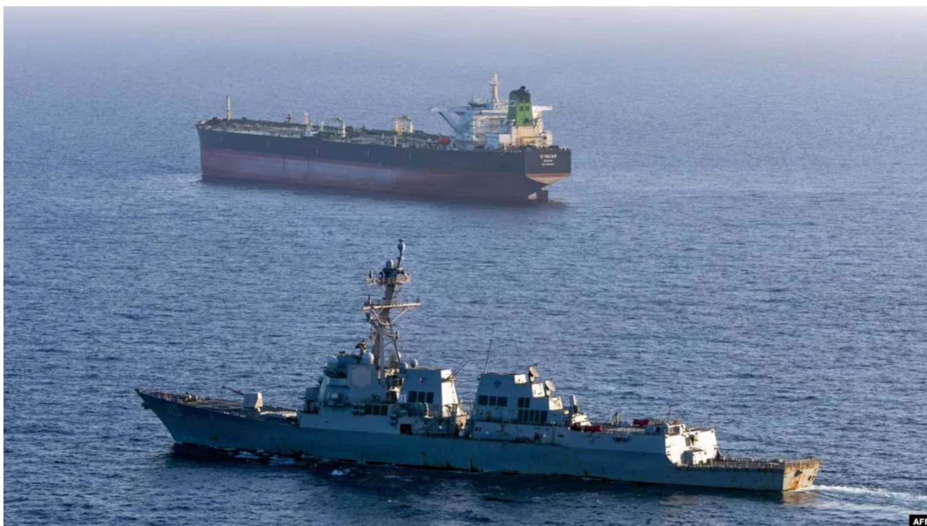
Фрегат США Rafael Peralta

Военные США в ночь на 28 мая сбили, по уточнённым данным, пять беспилотников и нанесли удар по наземной станции управления в иранском портовом городе Бендер-Аббас, где готовились запустить шестой беспилотник. Об этом сообщило Центральное командование Вооружённых сил США (CENTCOM). Ранее CNN и другие СМИ со ссылкой на неназванного американского чиновника сообщили о четырёх сбитых беспилотниках.