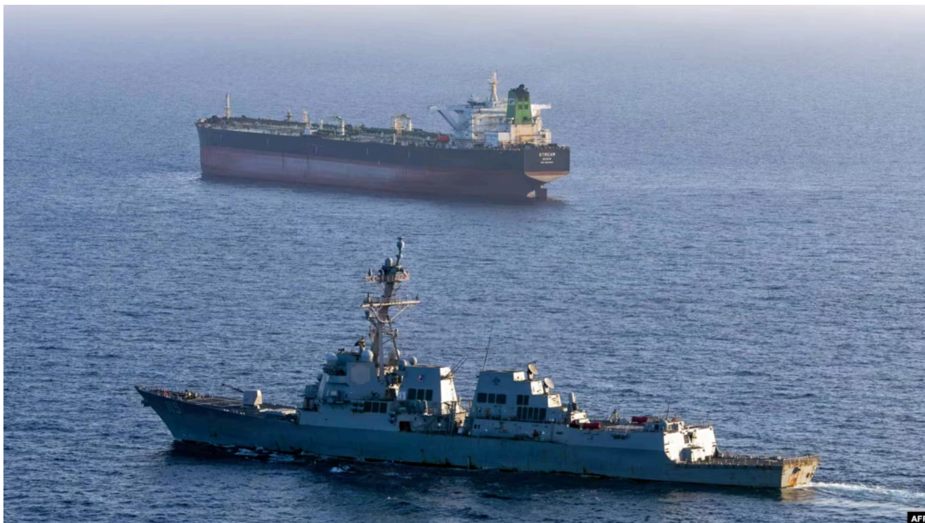
Фрегат США Rafael Peralta

Военные США в ночь на 28 мая сббили четыре беспилотника и нанесли удар по наземной станции управления в иранском портовом городе Бендер-Аббас, где готовились запустить пятый беспилотник, сообщают CNN и другие СМИ со ссылкой на неназванного американского чиновника.