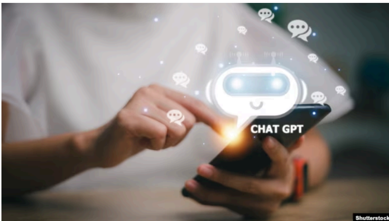
Общение с ИИ, иллюстративное фото

профессионалов: когда появились модели, которые производили изображения очень высокого качества, среди художников началась заметная паника. Я имею в виду не современных художников, не contemporary, а тех художников, которые зарабатывают на жизнь фигуративной живописью, которая продаётся на ярмарках в любом среднем американском городе.