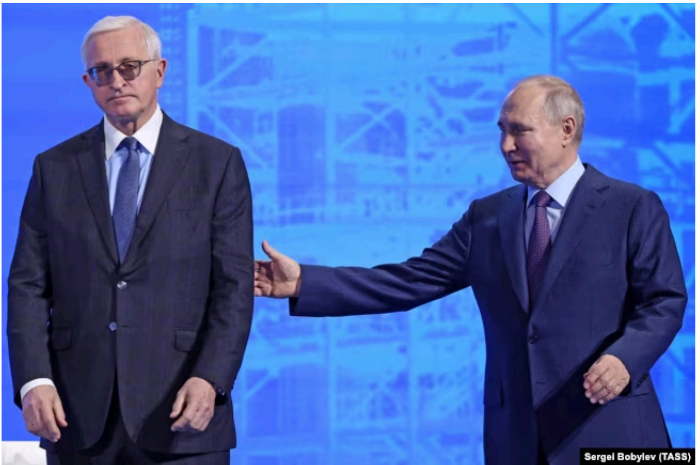
Владимир Путин и президент Российского союза промышленников и предпринимателей (РСПП) Александр Шохин