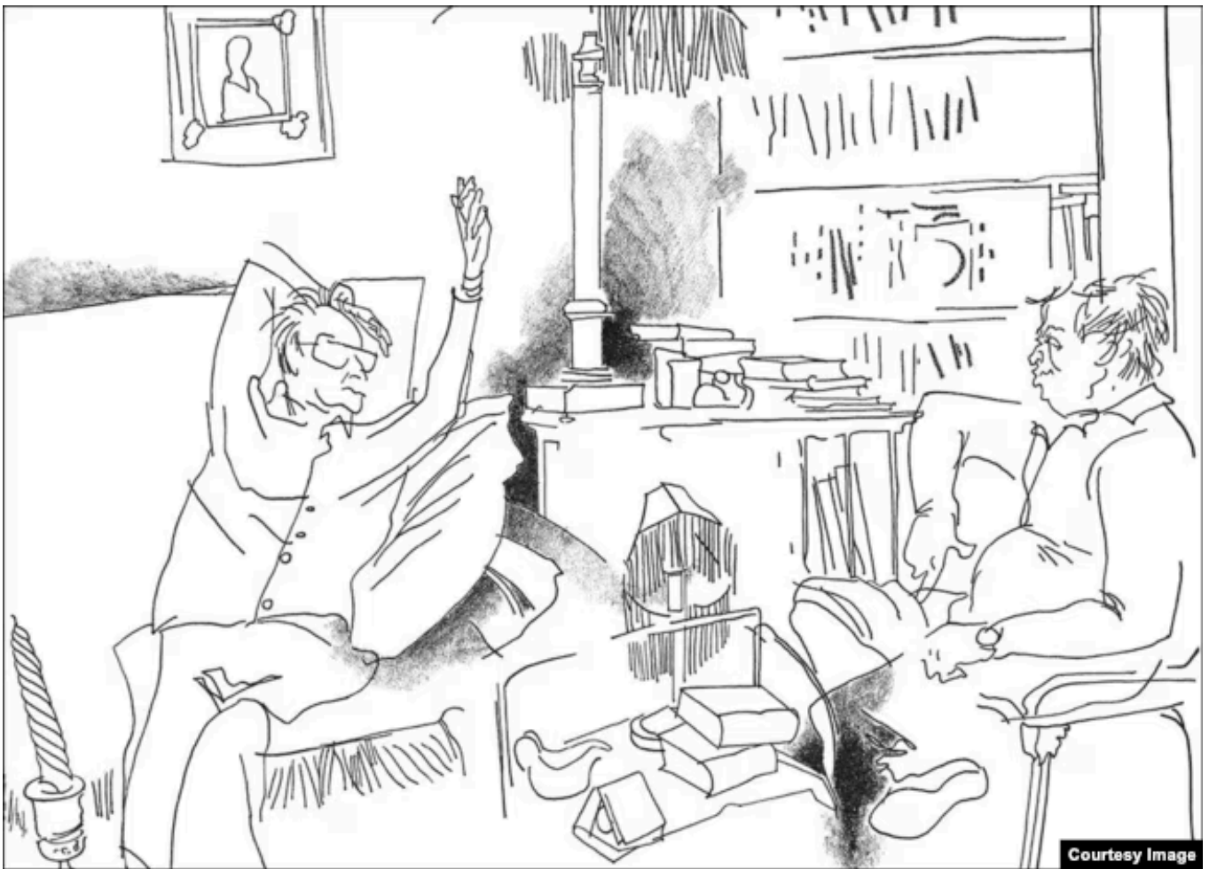
Сергей Ермолинский и Натан Эйдельман. Литография Бориса Жутовского, февраль 1983.