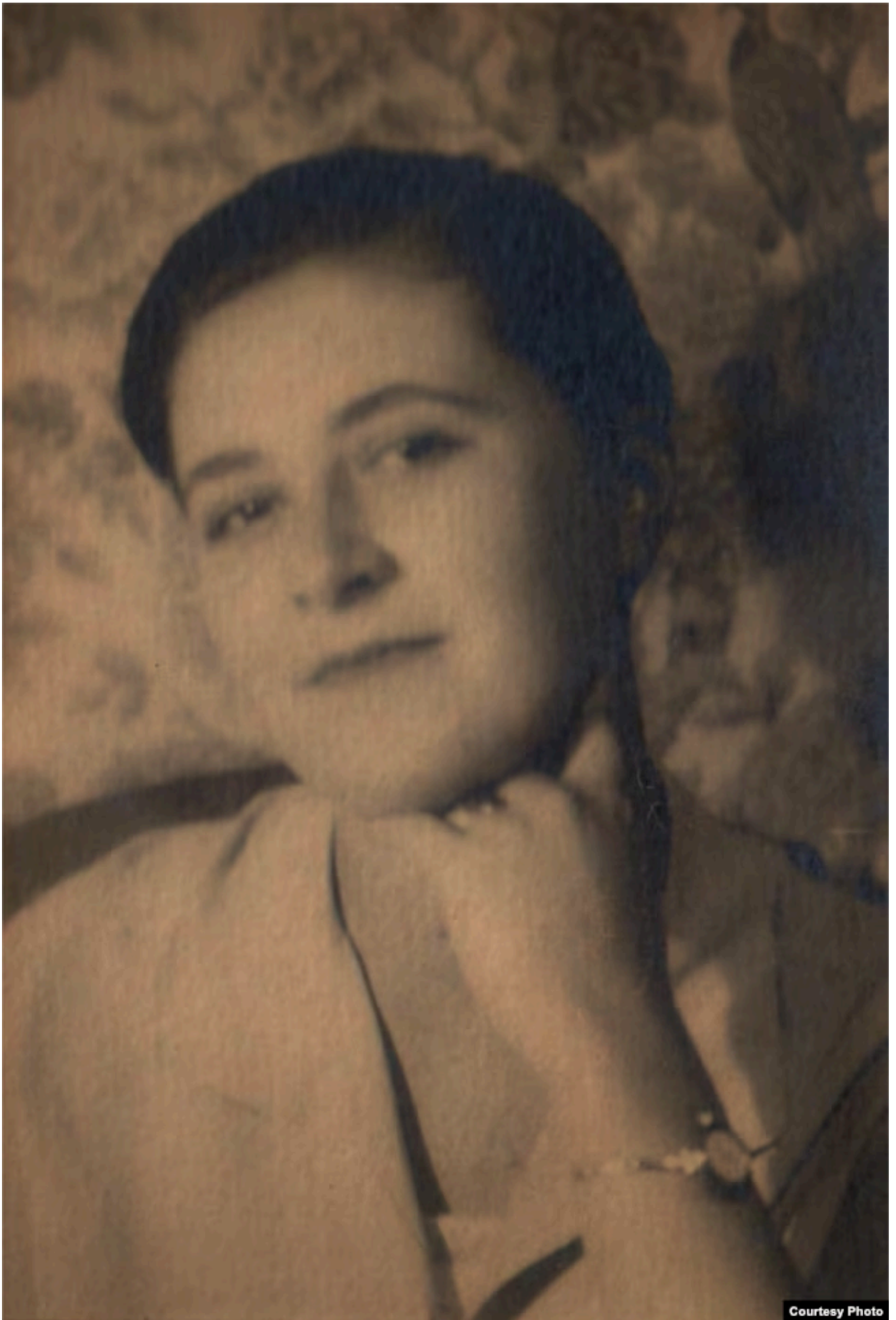
Марика Чимишкиан, конец 1920-х.