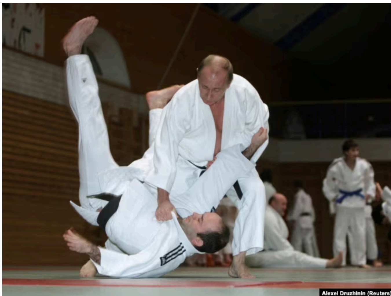
Владимир Путин на тренировке по дзюдо, 2009 год