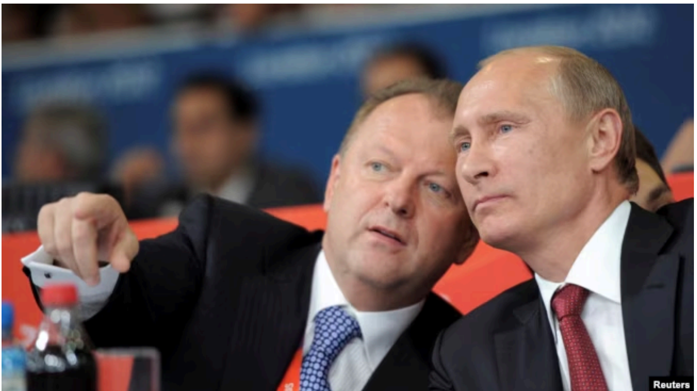
Путин и Визер на Олимпийских играх в Лондоне, 2012 год

Ярким примером можно назвать Международную федерацию дзюдо и ее многолетнего президента Мариуса Визера: еще в 2008 году он сделал российского президента Владимира Путина, который в детстве и юности занимался этим видом спорта, почетным президентом организации – Визера и Путина часто называют "близкими друзьями". В феврале 2022 года российского президента отстранили от этой должности.