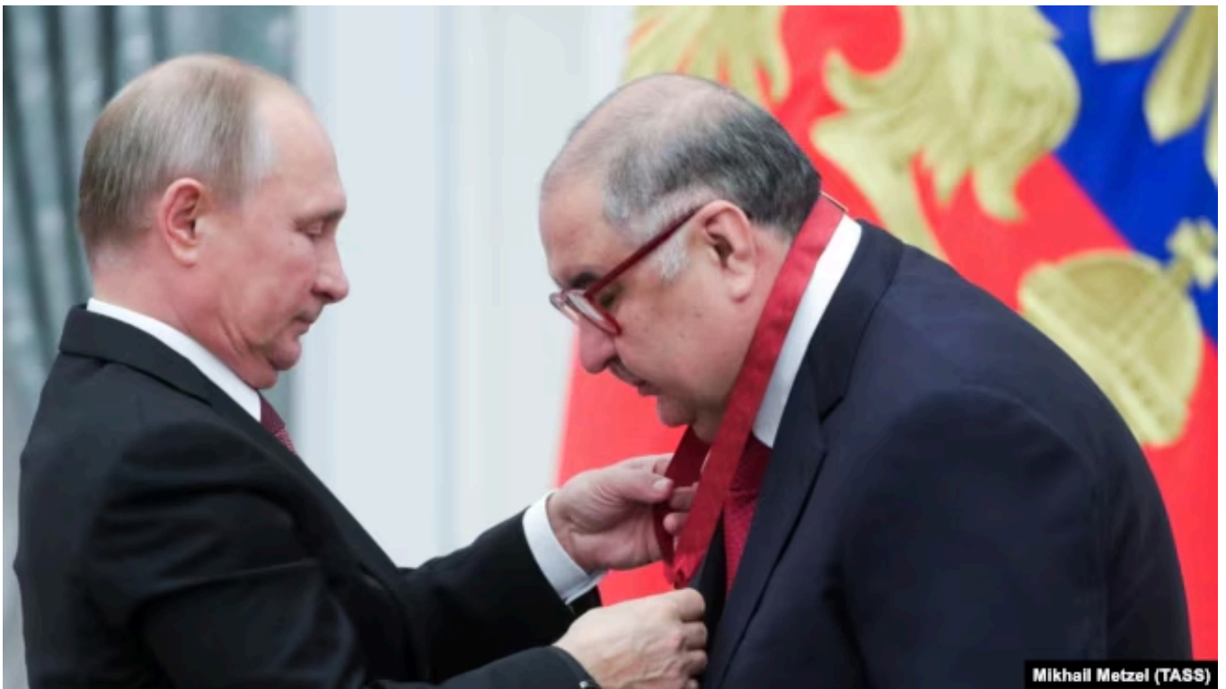
Путин вручает Усманову награду, 2018 год