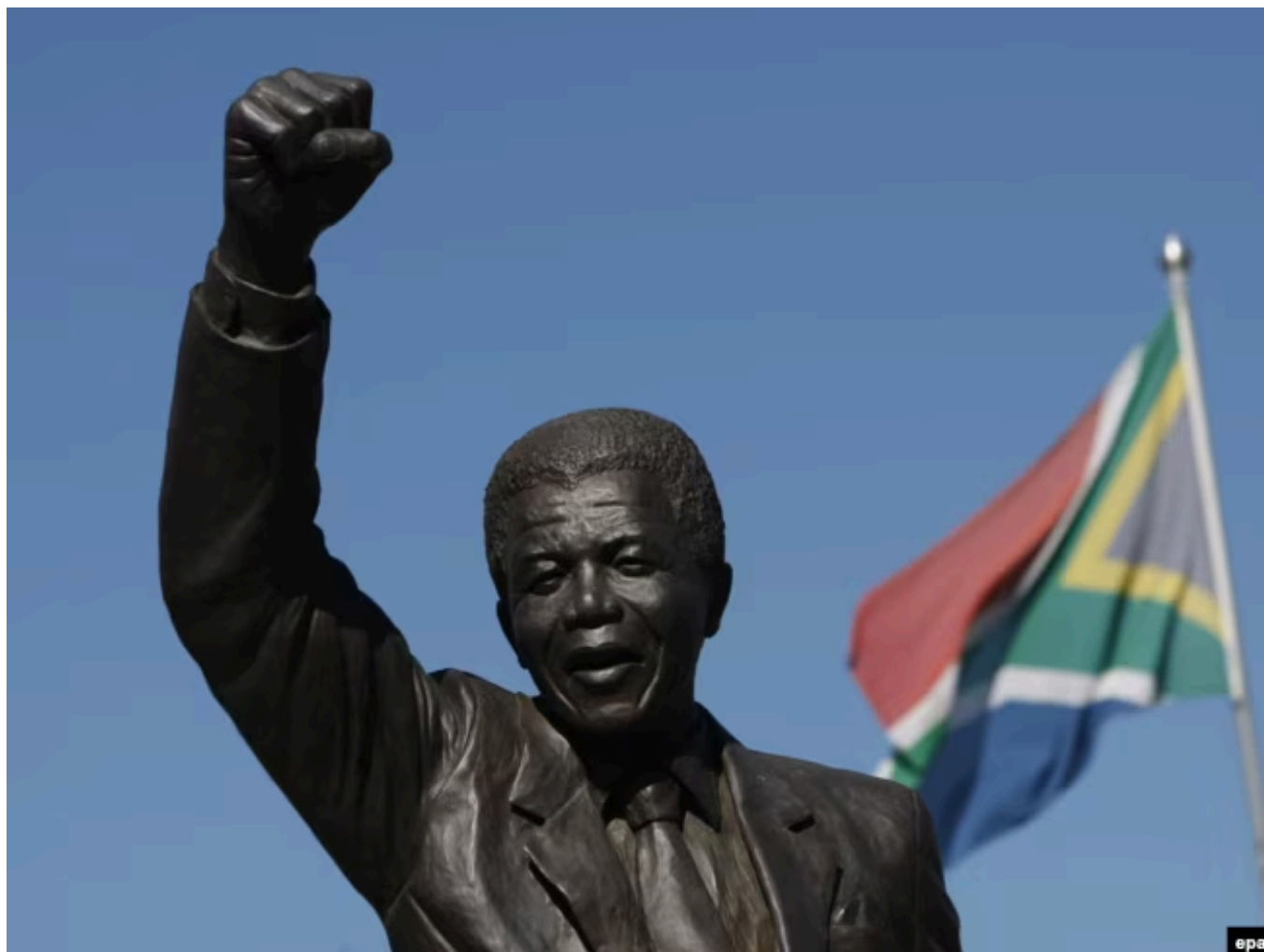
Памятник Нельсону Манделе, ЮАР, 2010 год

В истории мирового спорта нет случаев перманентного отстранения государства от соревнований, а самым долгим таким случаем можно назвать отстранение ЮАР из-за политики расовой сегрегации – страна не принимала участие в Олимпийских играх почти 30 лет и вернулась на них лишь после смены политического режима.