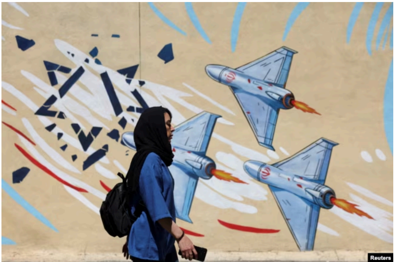
Антиизраильские граффити на улице в Тегеране. 26 мая 2026 года

Также в нем звучит призыв к мусульманам и "угнетенным всего мира, в особенности молодежи" постоянно повторять лозунги "Смерть Израилю" и "Смерть Америке". Будущее человечества, по мнению Хаменеи – за "исламской нацией и исламской цивилизацией", которой необходимо еще решительнее, чем прежде, "отмежеваться от "многобожников", а также Америки и Израиля".