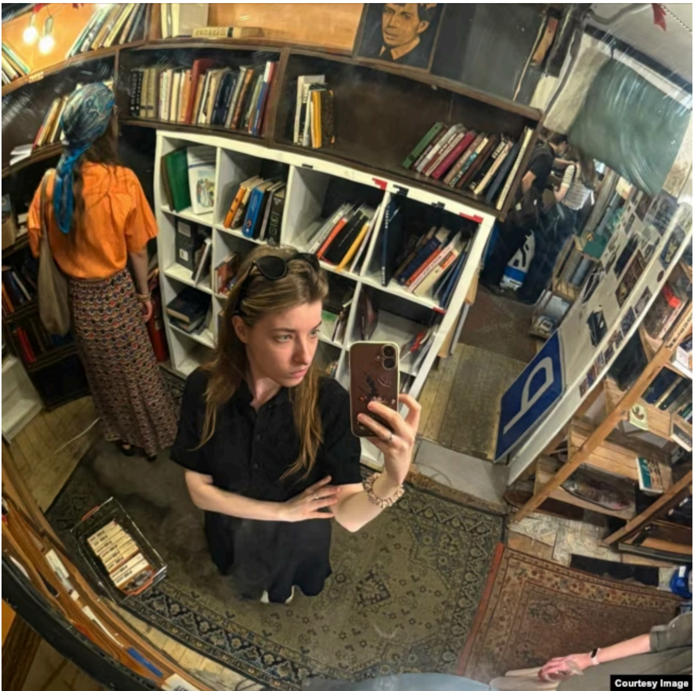
Книжный магазин "Ходасевич"

– Сначала речь шла об иноагентах, а прошлой осенью запретили уже любые книжки, допустим, Быкова или Гениса. Первое время еще можно было продавать с пометкой, потом уже вообще никак. А дальше всё пошло в разнос, начали искать наркотики и всякое ЛГБТ – если Анна Каренина принимала морфий, нужно наклейку клеить: наркота в книжке присутствует. То есть цензура окончательно оборзела. Как говорил Шкловский, "Уступая дорогу трамваю, мы делаем это не из вежливости". Если хочешь работать в этих условиях, надо соблюдать все правила. И если издательство присылает список книг, снимаемых с продажи, то не снять их – это глупая фронда: для независимого книжного штраф в 600 или 800 тысяч – половина годового оборота, ее неоткуда взять. Короче, или ты выполняешь законы, какие бы они ни были – или закрываешься.