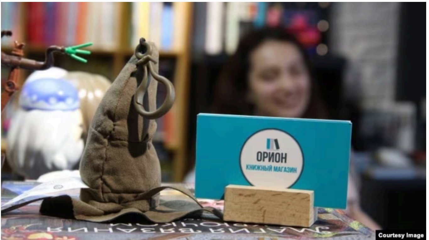
Книжный магазин "Орион"

Люди пишут и о том, что на маркетплейсах книги дешевле, и о том, что малый бизнес не выдерживает выросших цен на свет и отопление, и о том, что "по книжным издательствам и книжным магазинам сильно ударило в том числе безмозглое ожесточение цензуры".