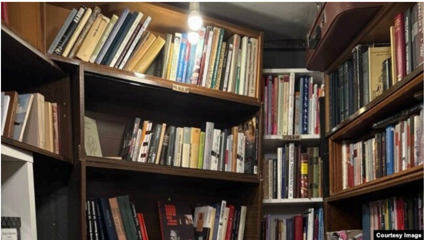
Книжный магазин "Ходасевич"