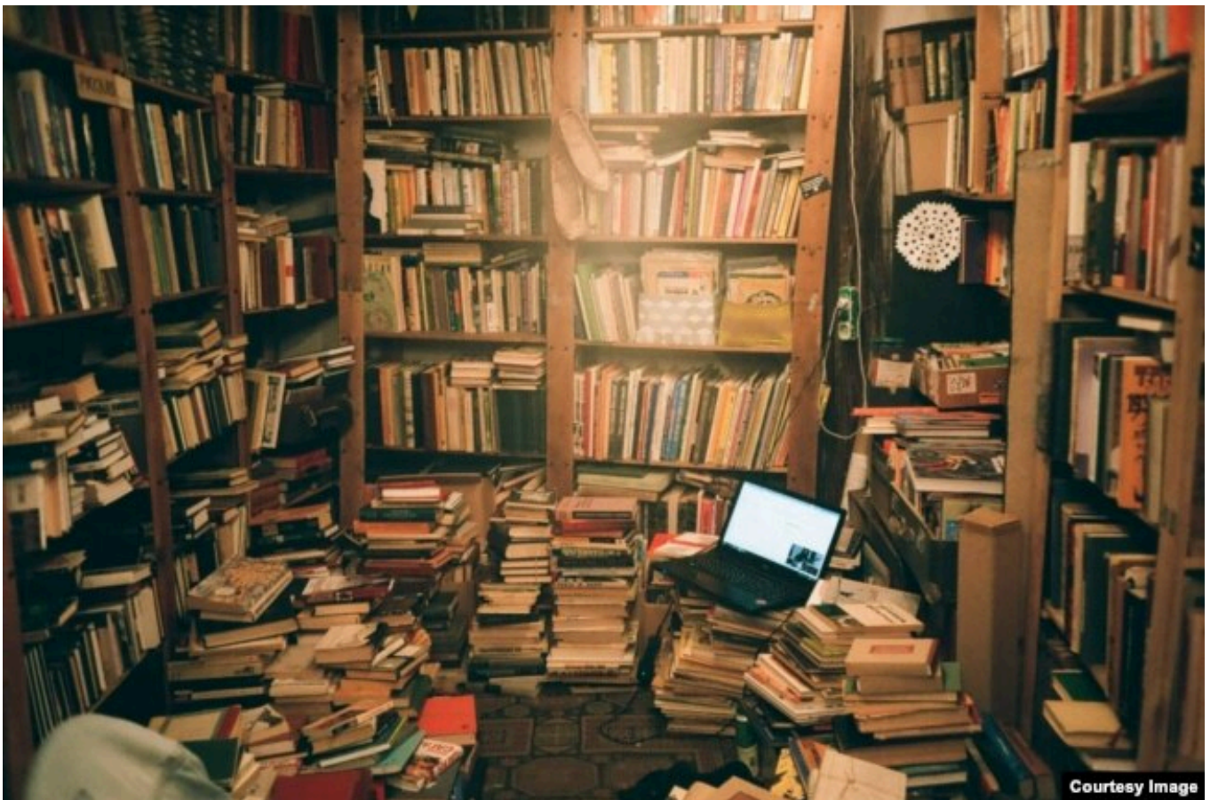
Книжный магазин "Ходасевич"

Ситуацию последних месяцев Федор называет "буйством абсурда".