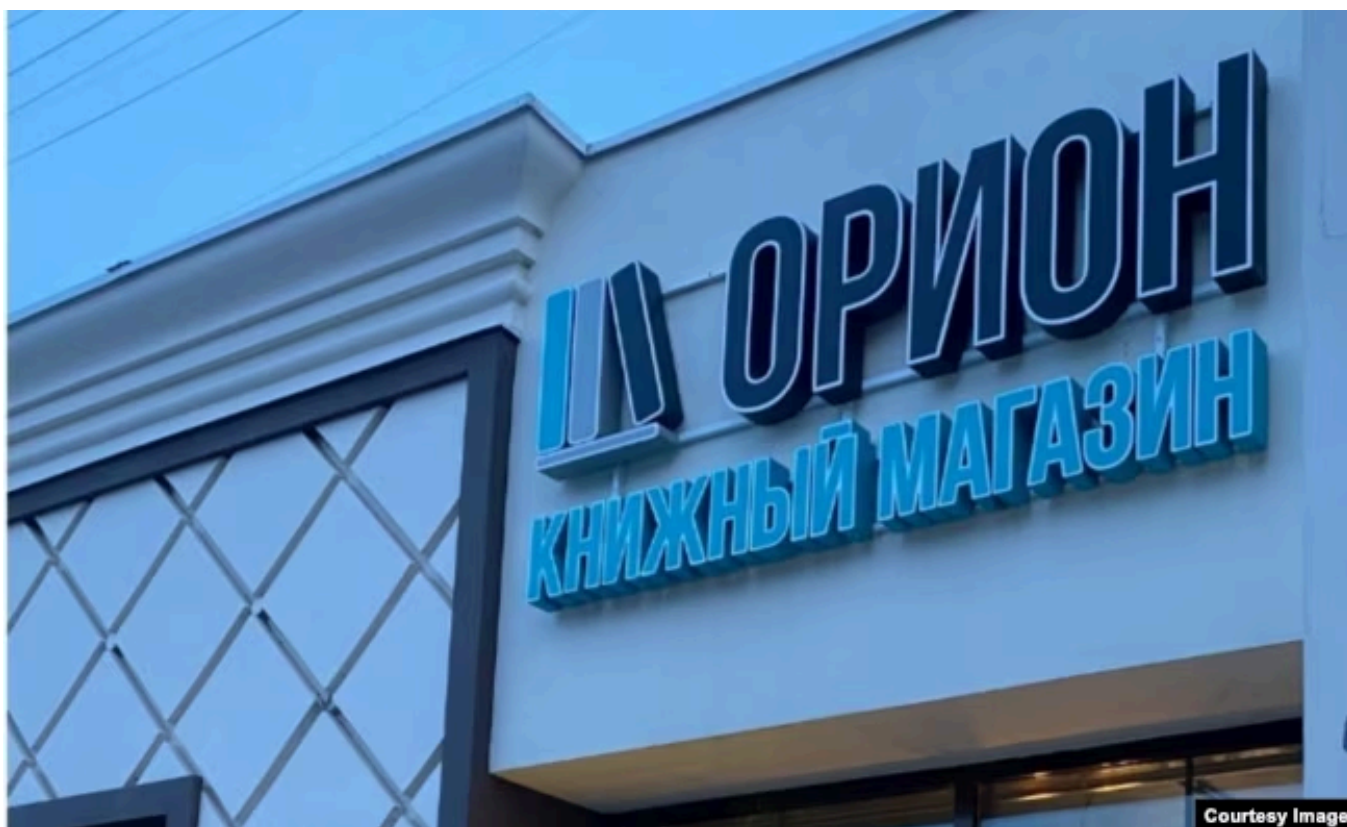
Книжный магазин "Орион"

работать". Однако в комментариях к сообщению о закрытии магазина люди прямо говорят о том, почему принято такое решение.