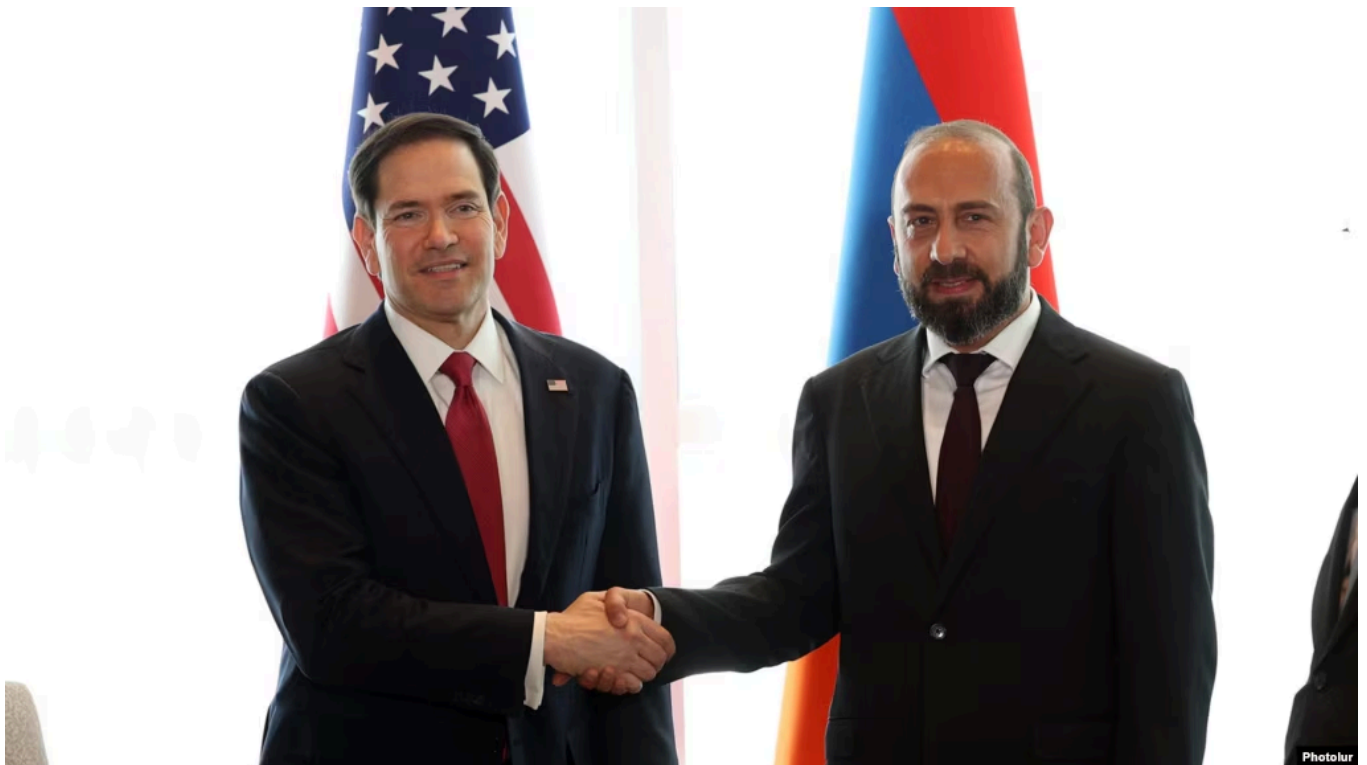
Рубио и Мирзоян

Госсекретарь США Марко Рубио в ходе визита в Ереван 26 мая подписал с главой МИД Армении Араратом Мирзояном хартию о всеобъемлющем стратегическом партнёрстве между двумя странами. Также были подписаны рамочные соглашения о критически важных минералах и редкоземельных металлах и о сотрудничестве при создании так называемого "Маршрута Трампа во имя международного мира и процветания" - транзитного коридора из Нахичевской автономной области Азербайджана через территорию Армении до основной территории Азербайджана.