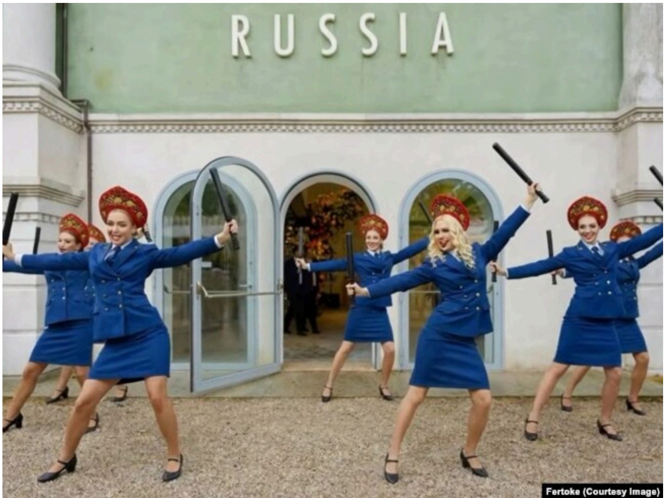
Кадр из клипа Fertoke "Биеналечная"

заполняет ИИ-агент, Fertoke предпочитает Claude (нейросеть компании Anthropic). Агент тащит ему все подряд, человек затем вручную сортирует изображения и идеи, отбраковывая мусор.