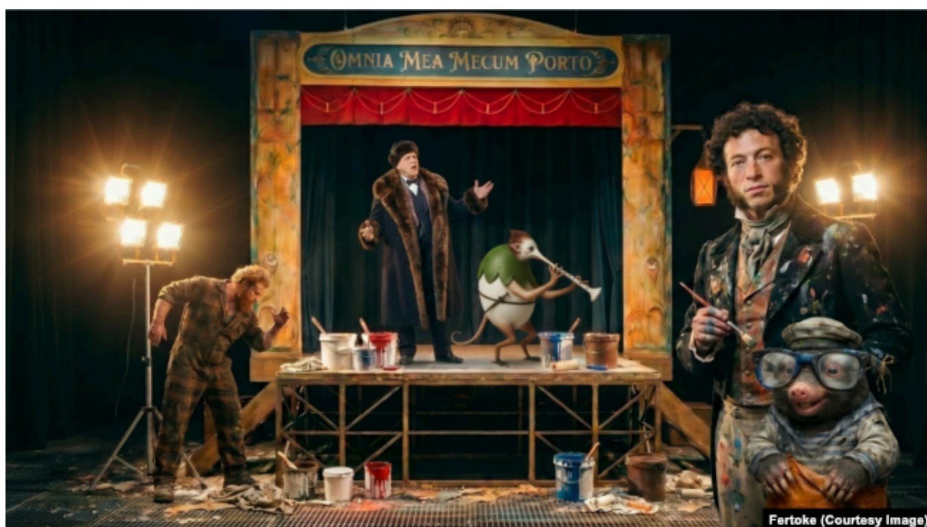
Персонажи ИИ-проекта Fertoke

Fertoke признается, что богател и разорялся в своей жизни несколько раз, и честно называет себя "не самым талантливым и удачливым" предпринимателем.