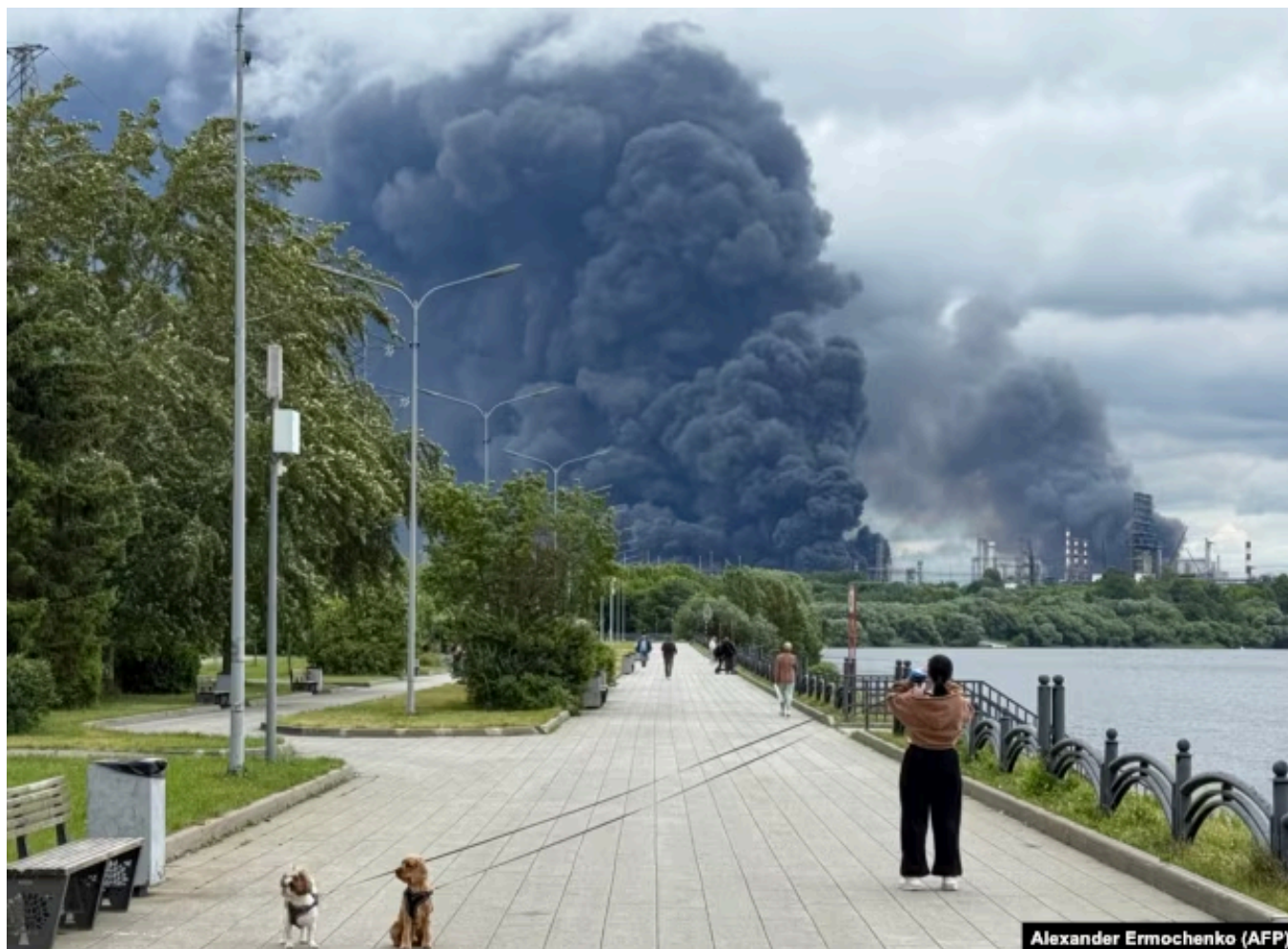
Пожар на Московском НПЗ после атаки беспилотников, Москва, Россия, 18 июня 2026 года

По подсчетам " Новой газеты Европа ", к середине июня полностью или частично была нарушена работа 13 российских нефтеперерабатывающих заводов. На эти предприятия приходится около 40% переработки нефти в стране, до 41% производства автомобильного бензина и до 44% дизельного топлива.