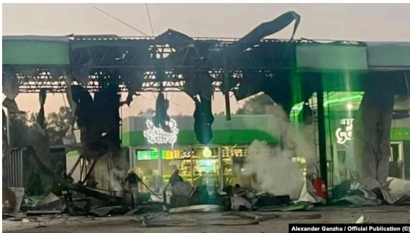
Последствия российского удара по АЗС в Днепропетровской области 1 июля

По данным близкого к российским силовикам телеграм-канала MASH, за последние несколько дней российские военные нанесли более 50 ударов по топливным цистернам и резервуарам АЗС в Черниговской, Херсонской, Запорожской, Днепропетровской, Сумской и Николаевской областях Украины. В Z-каналах также утверждают, что не осталось работающих заправок на трассе, соединяющей Харьков и Днепр, но украинские власти эту информацию не подтверждали.