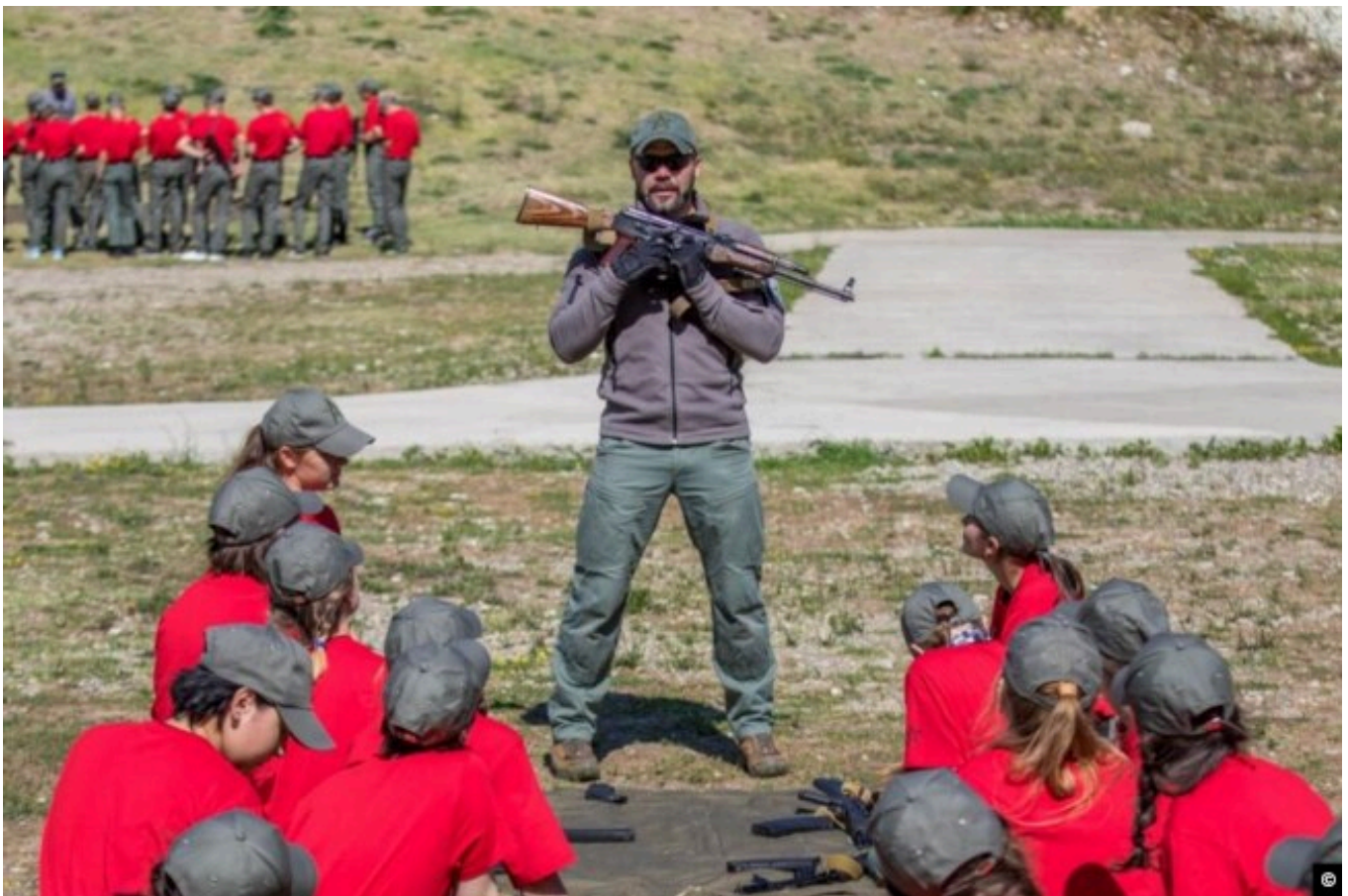
Школьники во время смены "Авангард" в лагере "Орлёнок".